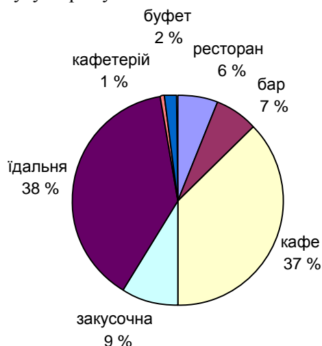
Рис. 1. Структура ПРГ Ковельсько-Турійського рекреаційного району (2012 р.)

Серед загальної структури ПРГ у Ковельсько-Турійському рекреаційному районі переважають їдальні (38 %) і кафе (37 %) (рис. 1). Найменша кількість припадає на буфети (2 %) та кафетерії (1 %). Найбільша кількість їдалень зосереджена в сільській місцевості, а кафе – у міській. Серед ПГГ найбільшу частку в рекреаційному районі займають туристичні бази й бази відпочинку (57 %), які зосереджено в Турійському рекреаційному підрайоні (Озерянський, Соминський, Турійський рекреаційні вузли) та готелі (30 %), 78 % з яких зосереджено в Ковельському рекреаційному підрайоні (Ковельський рекреаційний вузол) (рис. 2). Мотелі (3 %) та дитячі табори (3 %) мають слаборозвинуту мережу.