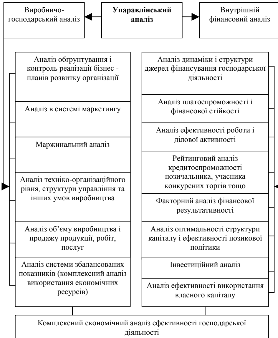
Рис. 1. Функціональні напрямки управлінського аналізу в компанії

В системі внутрішньогосподарського управлінського аналізу є можливість поглиблення фінансового аналізу за рахунок залучення даних виробничого управлінського обліку. Питання фінансового та управлінського аналізу взаємопов'язані при обґрунтуванні бізнес - планів, контролі за їх реалізацією, в системі маркетингу. Особливостями управлінського аналізу є: