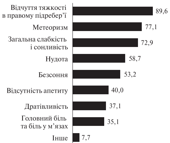
Рис. 2. Частота скарг пацієнтів, %