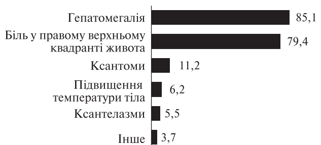
Рис. 3. Дані фізикального обстеження, %