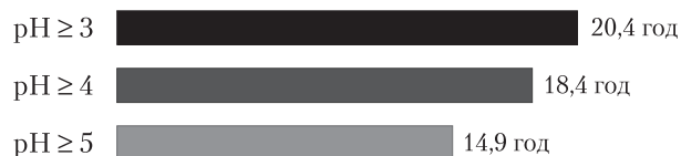
Рис. 1. Тривалість кислотоблокувальної дії пантопразолу («Нольпаза») відповідно до критеріїв ефективного ацидоінгібування при лікуванні кислотозалежних захворювань органів травлення

Частка вимірів із внутрішньошлунковим рН \geq 3,0 за нічний період часу дорівнювала ( 81,9 \pm 7,5 ) % від усіх вимірів внутрішньошлункового рН цього періоду, або ( 7,4 \pm 0,7 ) год, частка вимірів із внутрішньошлунковим рН \geq 4,0 – відповідно ( 72,9 \pm 7,8 ) % та ( 6,6 \pm 0,7 ) год. Частка вимірів із внутрішньошлунковим рН \geq 5,0 – ( 62,5 \pm 8,8 ) % і ( 5,6 \pm 0,8 ) год.