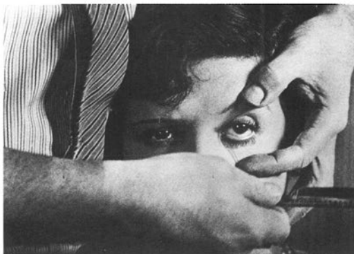
«Андалузський пес». Режисер — Луїс Бунюель

«Щоденник покоївки» Режисер — Луїс Бунюель