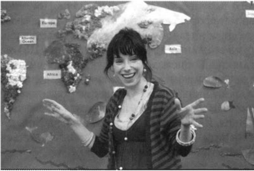
«Стандартна процедура» («Standard Operation Procedure»). Режисер — Еррол Моріс «Безтурботна» («Happy-Go-Lucky»). Режисер — Майк Лі