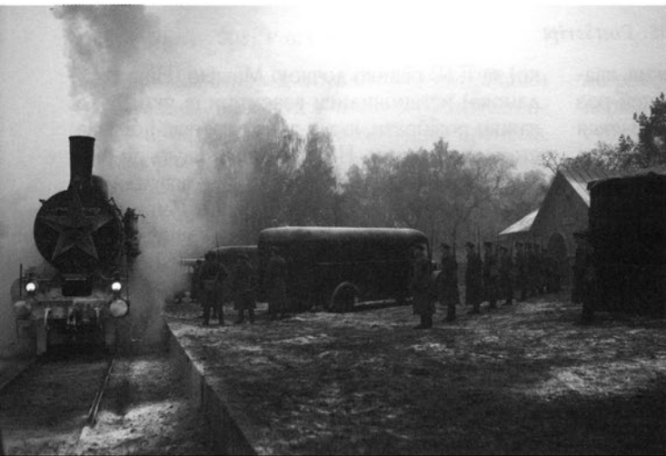
«Катинь». Режисер — Анджей Вайда

зерки вправляються біля жердин, незатребуваний співак А.К. п'є пиво й органічно влітає “перли” нецензурної російської лексики в канву англійських фраз. Тут у природності виконавцям не відмовиш — вони просто тотожні собі. Гірше, коли виконавці намагаються грати: відчувається гострий брак “диригента”, тобто режисера, хоча в титрах і значиться цілком розкручений бренд.