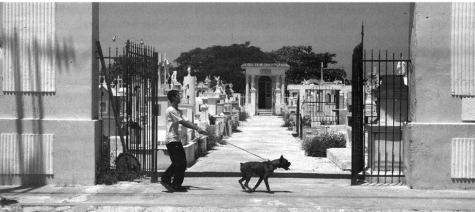
«Озеро Тахо» («Lake Tahoe») Режисер — Фернандо Еймбке

ного змагання, як «Берлінале»? При цьому в супутних програмах часом демонстрували цілком конкурентноздатні картини, не допущені селекційною комісією до конкурсу. У числі фільмів, відхилених від змагання, хочеться назвати картину сербського режисера Стефана Арсенійовича «Любов та інші злочини», показану в спеціальній програмі Панорами і на кіноринку. Дія відбувається в Новому Белграді, десь на маргінесах міста, умовно розділеного кримінальними угрупованнями на «зони впливу». Реалії життя в цьому «новому світі» зняті жорстко, майже документально, і тому особливо страшно. За статистичними даними, тільки за останні 15 років з Сербії виїхало 300 000 молодих людей. Героїня фільму Аніка також хоче назавжди виїхати з країни. Гроші на дорогу вона збирається викрасти з сейфа свого коханця — кримінального авторитета Мілютіна. Разом з Анікою мріє виїхати закоханий в неї з дитинства молодий підручний Мілютіна — Станіслав. У фільмі показано останній день Аніки, проведений в Сербії: готуючись покинути рідне місто назавжди, героїня зустрічається з людьми, які були частиною її життя.