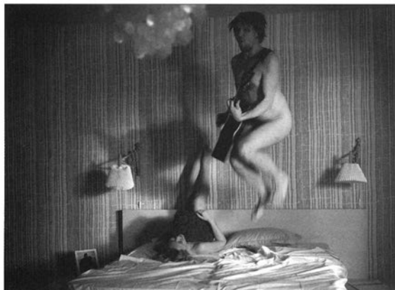
«Чорний лід». Режисер — Петрі Котвік