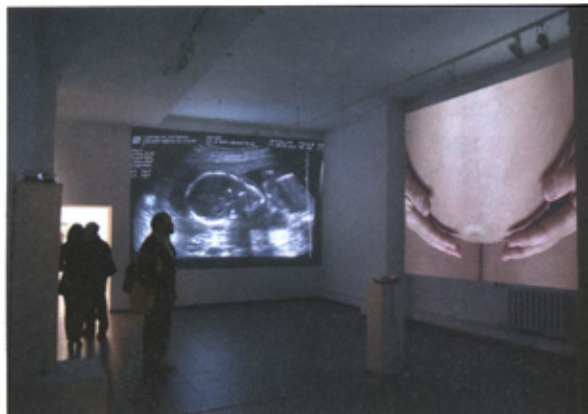
Оксана Чепелик. «Генезис / Genesis», 4-екранна відеоінсталяція. 2008

«Генезис / Genesis», експозиція «Немовлята на замовлення_фрагмент». GoranFest, Київ, 2008