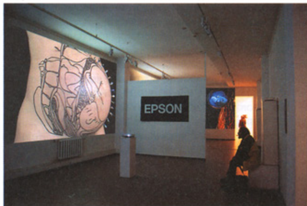
Оксана Чепелик. «Генезис / Genesis», 4-екранна відеоінсталяція. 2008