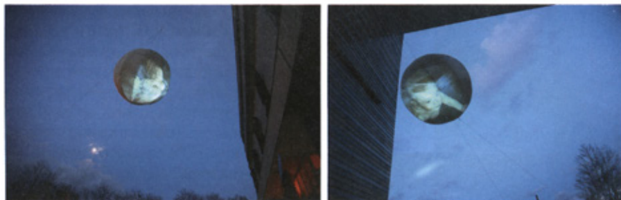
Оксана Чепелик. Проект «Генезис /Genesis», real-time медіаінсталяція «Origin / Початок» Львівська площа, Київ, 2008

Генезис (англійською — genesis ) — походження, становлення і розвиток, результатом якого є певний стан об'єкта, що вивчається. Так генезис природних і соціальних явищ цікавив і цікавить філософію й науку з античності до наших днів. Пояснення генезису природних і соціальних об'єктів отримало наукове пояснення в еволюційних теоріях дисциплінарного, міждисциплінарного, загальнонаукового і філософського характеру. Розгляд у сучасній науці і філософії природних і соціальних об'єктів, що вивчаються як багаторівневі складні системи, здатні самоорганізовуватися, саморегулюватися і саморозвиватися, призвело до формулювання концепції системогенезу Л.Н.Северцовим та детальної розробки і виявлення П.К.Анохіним таких закономірних тенденцій цього процесу, як мінімальне забезпечення становлення системи, що зародилася, гетерохронна закладка її компонентів 2 , їх консолідація у напрямі отримання корисного для системи результату, відносність принципу історизму в поясненні перемикання функціональної системи з однієї програми на іншу. Пояснення генезису природного і соціального буття в сучасній науці пов'язується і з принципами глобального еволюціонізму, структурно-синхронічним і генетично-діахронічним вивченням об'єктів 3 .