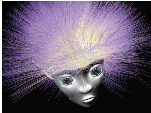
Ламії «Настройки» (Ламія «розплющує очі»)

перегородка, котра як стріла (про символ стріли — трохи нижче) розділяє (позначає, підкреслює) асиметрію правого й лівого ока Ламії (це як не випадково асиметричні клешні краба — одна називається «клешня дроблення», інша — «ріжуча»: Ламія «полює очима» «як клешнею», а мисливець споглядання полює «крізь» очі Ламії). Одномоментно: погляд споглядача торкається стислос-