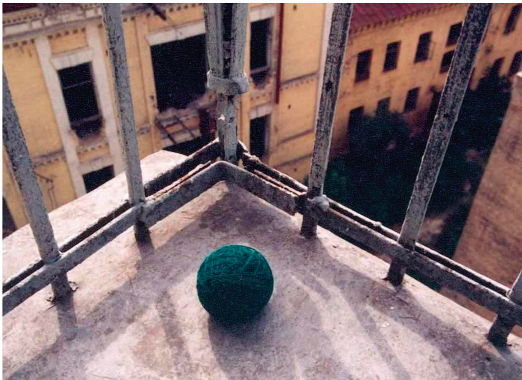
Балкон на Стрілецькій. Фото

та потвора з обличчям жінки, з пазурами [5] на руках і ногах (символ ненажерливості); демон бурі і смерті» [6]. Якраз те, що нам і треба для «шліфовки» (акцентованого завершення образного ряду). Річ в тім, що міфологічні істоти-сили живуть більш вагомим і, сказати б, значно більш «реальним» чином у нашому ж власному Позасвідомому, аніж в книжковій сфері. Але з «ходом Історії» (міфологічні істоти — «позаісторичні») вони, «покинуті непризволяє» власною «земною» культурою (котру радше вони створили, а не навпаки), «розмивають свої абриси», частково «зливаючись» й частково переходячи одне в одне.