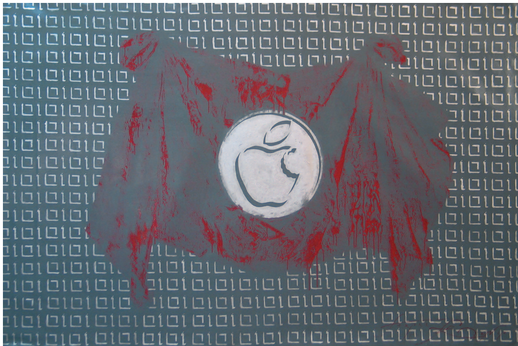
Arle спокуси. 145 × 220, полотно, олійні поливи

Символізм еволюційний. А Інтернет-ме­режа гарантувала миттєве його розповсю­дження. «Знак потребує виявлення своєї суті, символ говорить сам за себе. А інтерпретація символів є — якщо не заміною філософії, то її нащадком» [3].