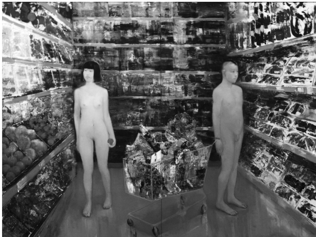
К. Акіменкова. Новий Едем , полотно, олія, 2013

тацію дійсності в різних просторово-часових межах. Матеріали статті можуть бути використані при подальшій розробці цієї теми, а також методології системного аналізу цього фундаментального поняття.