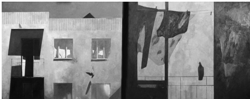
І. Черенков. Тиша , полотно, олія, 2013

дія, що сталася 11 березня 2011 р., призвела до масштабних руйнувань, які художниця зобразила у своїй картині крізь призму ролі людського фактору. Як зазначає автор твору, у цій роботі вона хотіла показати не стільки особисту трагедію японського народу, скільки масштаб лиха і надзвичайно потужну стихію природи, яку людина не в змозі контролювати. Тому композицію побудовано так, щоб показати, як співіснують атрибути життя людини з природним середовищем, в якому залишається все менше чистих зон, чистих земель — що на полотні символізують пагорби на горизонті. Величезний перекинутий корабель своїм хвостом ніби сягає тих земель.