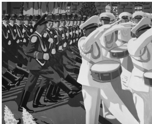
К. Гнилицька. Парад Незалежності, полотно, олія, 2009

ла увагу художників в усі часи, але у вироблені стилістики та емоційної тональності художниця звернулася до творчості Каспара-Фрідріха Давида, Віктора Попкова, Андрія Репнікова, Павла Риженко. У картині «Моя планета Хрещатик» автор зобразила один з моментів у житті молодої жінки-двірника під час її роботи, а саме очищення даху від снігу — проте не сам процес, а хвилину відпочинку, коли, підійшовши до огорожі, жінка дивиться на панораму міста Києва з особливого ракурсу, неприступному переважній більшості людей. У такому місці відчувається безмежність простору, позначеного у жіночому фокусі символами міста Києва й самого Хрещатика. Саме тут можна відчути себе іншим — романтиком, ліриком, мрійником, думки якого сягають далеких просторів, не зважаючи на всі складнощі обраної професії. Тут реальне поєднується з ірреальним, посилене віддзеркаленням скляних споруд. Юля майже повністю відмовилася від другорядних деталей і за принципом пленерного живопису намітила основні форми та змістовні зв'язки між ними, в окремих місцях навіть полишивши чистим полотном, надаючи можливість кожному зануритися в цей світ, наповнити його своїми емоціями й відчуттями. Такий крок можливий завдяки фронтальному розміщенню фігури