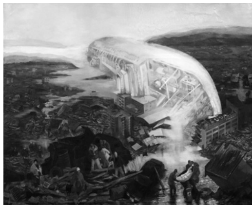
Н. Михайлова. Апокаліпсис , Полотно, олія, 2013

нукати глядача замислитися над їх вирішенням.