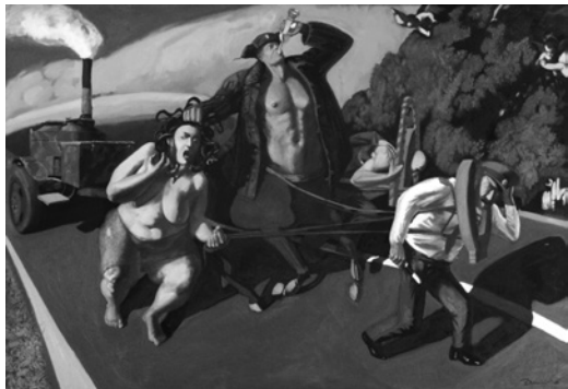
С. Дігтярьов. Вершинники. Апокаліпсис , полотно, олія, 2012