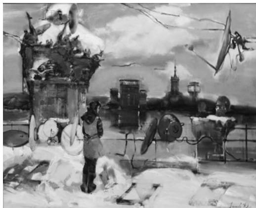
Ю. Істратова. Моя планета Хрещатик , полотно, олія, 2013