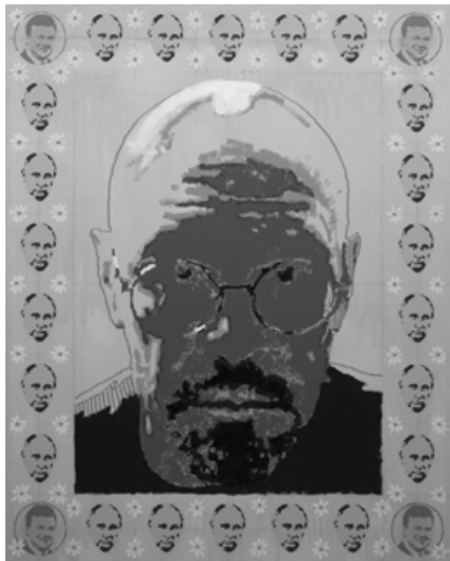
Автопортрет із хохломою , акрил на полотні, 200 x 160 см, 2014