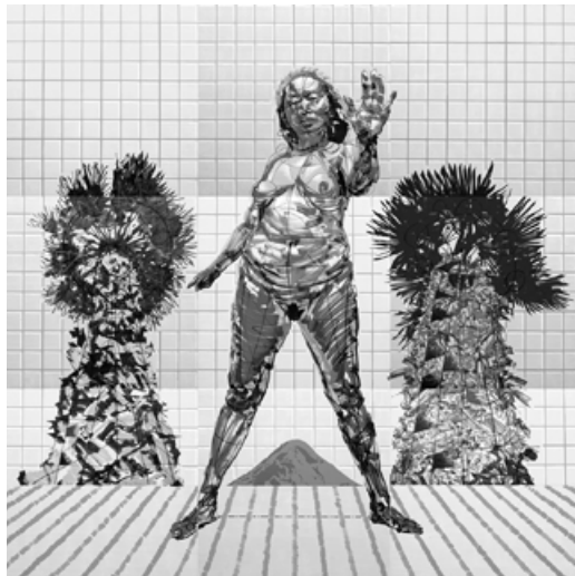
Шлях Вінні , акрил на полотні, 300 x 300 см, 2013

сальним» [22, с. 138], як висловився сам митець. Після навчання в Києві працював художником-оформлявачем у Миколаївському художньому фонді. Близько року (1978–1979) він малював плакати, таблички, стенди тощо — «створював наглядну агітацію». Уже тоді для Тістола склалася тема «стереотипу», яку він розвиватиме у подальших своїх проектах.