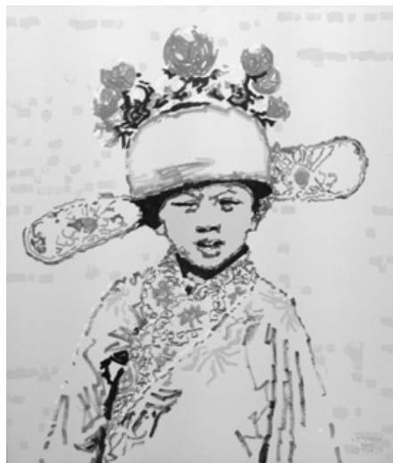
IV Китаєць, акрил на полотні, 150 x 130 см, 2009

у протилежних часових вимірах: переосмислювати попередні національно-авангардні здобутки початку ХХ ст., заразом вбираючи сучасні тенденції інших країн, і у такий спосіб входити у світовий контекст.