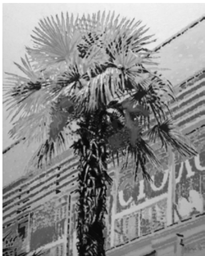
ЮбеКа, олія на полотні, 200 × 160 см, 2007