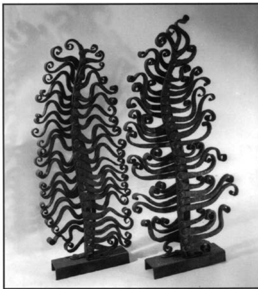
Папороть, 1979, метал, ковка