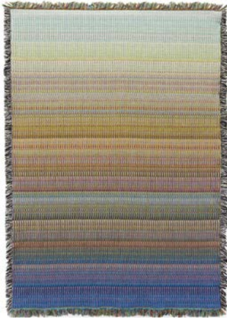
6. Філіп Стернс. Glitch Textiles , вовна, тканиня, 2012