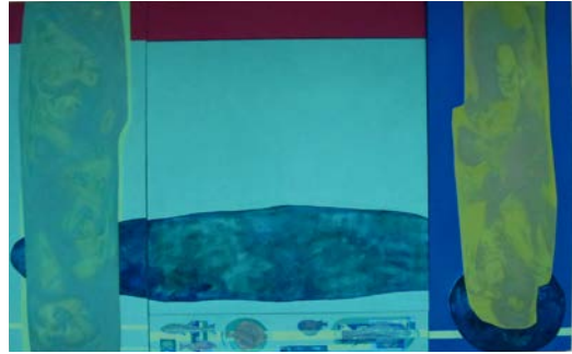
11. Каніковська П. Частина цілого. Частина сьома, полотно, змішана техніка, 2017

і вічність, буденне і духовне. Ці опозиції гармонійно поєднано через композиційну паузу, а також співвідношення синього, зеленого, бордового відтінків у колориті. Стилїстика та композиції роботи розроблялася у контексті вивчення творчості Іва Кляйна, Вернера Тьубке, Розі Менкман, а також напрямів модернізму та цифрового мистецтва глітч-арту.