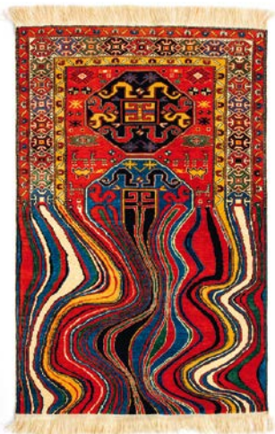
7. Фаїг Ахмед. Килим «Масляне», вовна, тканиня, 2012