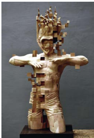
8. Су Тун Хан. Пікселізована, дерев'яна скульптура, 2016