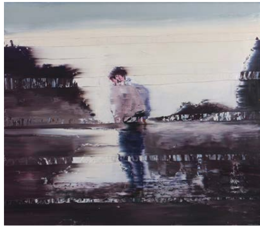
5. Анрі Денслер. Місце призначення , полотно, олія, 2015

ти глітч-арту в дизайні інтер'єру та екстер'єру, який продемонстрував Домінік Петріна, взявши за основу класичні восьмибітні зображення, які виконані у техніці pixel art, що з'явилася у цифровому мистецтві у кінці 1970-х. Взаємодія глітч-арту з простором своєрідно відобразилася і в дерев'яній скульптурі тайванського художника Ссу Тун Хан (Hsu Tung Han), який через привнесення в неї «пікселізації» (рис. 8) розмірковує над протиріччям сучасного світу і технологіями, яке формує диспозицію погляду на цифровий світ, що повільно руйнує традиційні методи мистецтва, або навпаки, як люди реструктурують технологію у традиційних видах мистецтва, оновлюючи його мову та сенси.