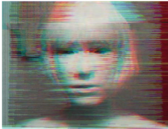
2. Роза Менкман. Лорі, цифрова обробка фото, 2016

логовими відеосигналами, використовує глітч як творчий елемент моделюючи абстрактні композиції, що нагадують калейдоскопічні окуляри. Мисткиня Олена Роменкова у серії «Glitch Diva» цікаво поєднала різні алгоритми помилки програмування з жанром автопортрету, або модним сьогодні напрямом selfie -нарцисизмом, виступаючи при цьому об'єктом і суб'єктом зйомки. Обробляючи фото комп'ютерною програмою вона практично знищує свій образ, полишаючи певні знаки реальності, як маркери буття. Оригінальні роботи створені Енду Денслером, Нельсоном Сілвою, Спенсером Селбі, Дженіс Чен Тіен Лі, Естера Лазовські, Алесандро Канова, Нейтор Магно та ін. у контексті цифрового мистецтва кінця ХХ — поч. ХХІ ст. вирізняються різнобарвними візуальними ефектами глітчу, що відсилають нас до прийомів модерністського живопису та його концепції деформації, але водночас конструюють нову естетику, обумовлену цифровими технологіями.