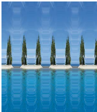
3. Адам Феріс. Лос-Анжелес, цифрова обробка фото, 2017