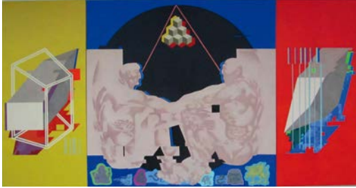
10. Куракіна-Новікова. Частина цілого. Частина п'ята, полотно, змішана техніка, 2017