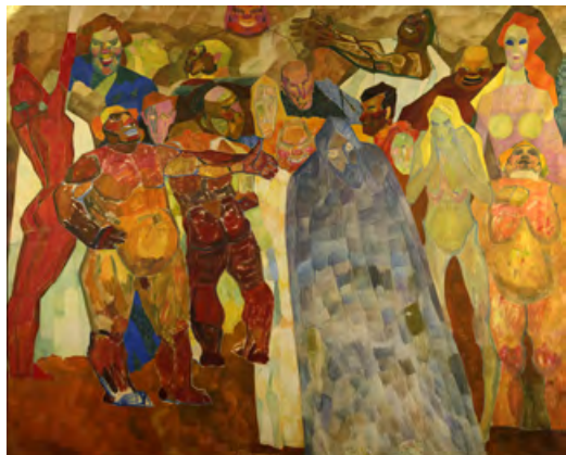
Осміяння I , картон, олія 245.7 x 320.7 см

вершення в створенні тематичної картини. Вищий інтерес до натури, особливо людської, вирізняє творчість Валерія Гегамяна. Ще в середині сорокових років він писав у своєму юнацькому щоденнику докладні описи складних емоційних станів людини та їхнє фізіономічне виявлення [3, с.4–5]. З часом художник не втратив інтерес до натури, але змістив наголос: його цікавитиме узагальнений образ, а не індивідуальні вияви людської природи. Навмисна акцентованість на загальному на протигагу індивідуалізованому дозволить митцю створити кращі зразки тематичних картин на всеохопні універсальні теми.