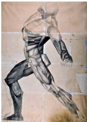
Атлет , папір, олівець, 239,5 x 171,5 см