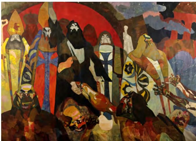
Повстання , картон, олія, 286,5 x 403,5 см

на діяльність викликає великий інтерес, адже митець не просто копіював настанови та методи інших навчальних закладів, передусім Ленінграда, куди особисто їздив за навчально-методичними матеріалами.