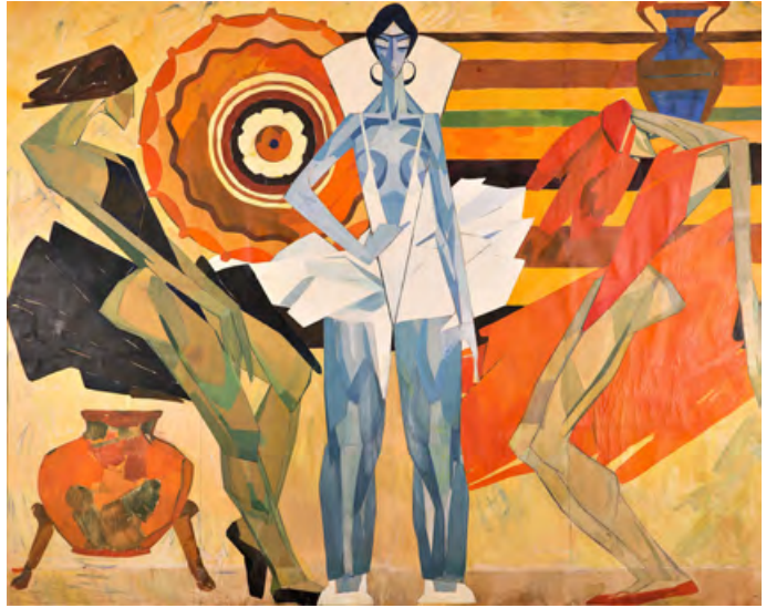
Три балерини , початок 70-х, темпера, картон, олія 319 x 257 см

Єревана. Мати майбутнього художника походила зі старовинного вірменського княжого роду Тер-Мелік Сиціан. Невдовзі батька Валерія репресували, справжнє прізвище стало небезпечним, і сім'я зуміла офіційно дати хлопцеві вигадане прізвище, утворене від імені діда — Гегама. Так з'явився Валерій Гегамян.