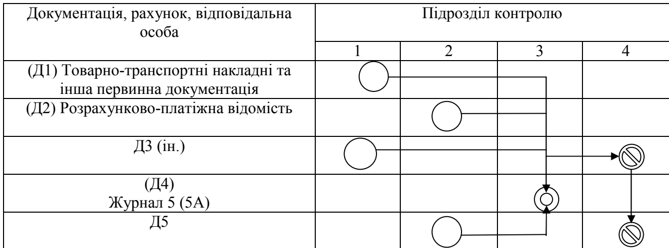
Рис. 3. Семантична мережа моделі подання даних для контролю

Поряд з цим, для забезпечення належного рівня орієнтації контролерів у питаннях функціонування не лише програмного забезпечення, але й вибору об'єктів контролю (в тому числі рахунків обліку та документів) важливо мати інформацію про семантику мережі подання даних. У нашому випадку орієнтовна модель семантичної мережі подання знань про витрати виробництва має включати не лише першоджерело даних – первинний документ, але й вихідну документацію, яка формується за результатами контролю (рис. 3).