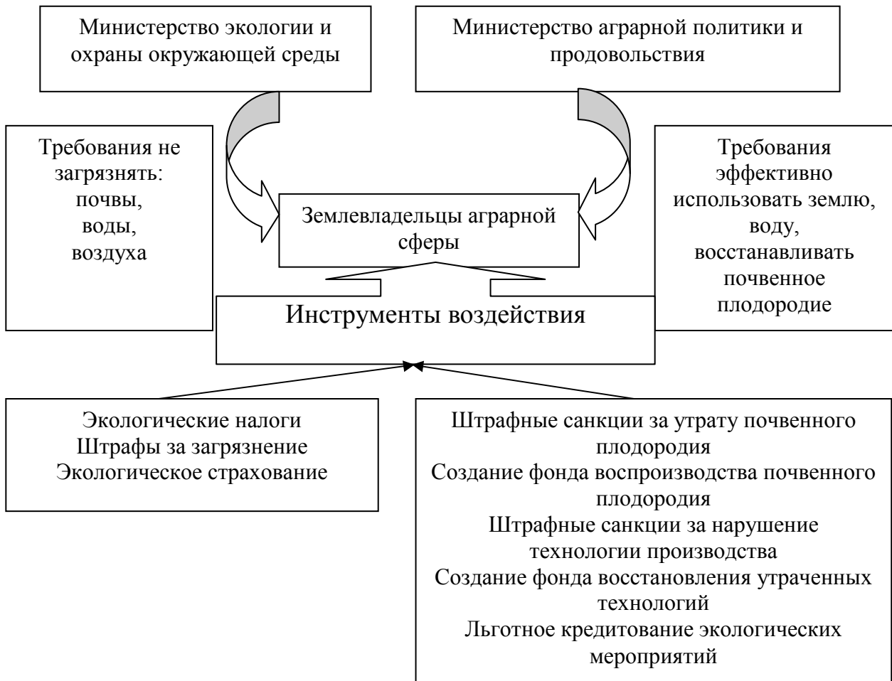
Рис. 1. Распределение функциональных обязанностей между министерствами в условиях инновационной модели аграрного природопользования

Общая схема модели инновационного организационно-экономического аграрного природопользования дана на рис. 2.