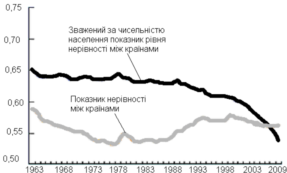
Рис. 1 Динаміка показників нерівності в розподілі доходів між країнами на рівні фізичних осіб, 1963-2009 рр. (коефіцієнт Джині). Джерело: [10]

як в розвинутих країнах вони продовжували зростати, хоча й повільніше, ніж в перші післявоєнні десятиліття. Як наслідок тенденції до повернення показників зростання в більшості країн, що розвиваються, та країн з перехідною економікою, що поєднується із сповільненням темпів зростання в розвинутих країнах, останнє десятиліття характеризується зниженням показника нерівності.