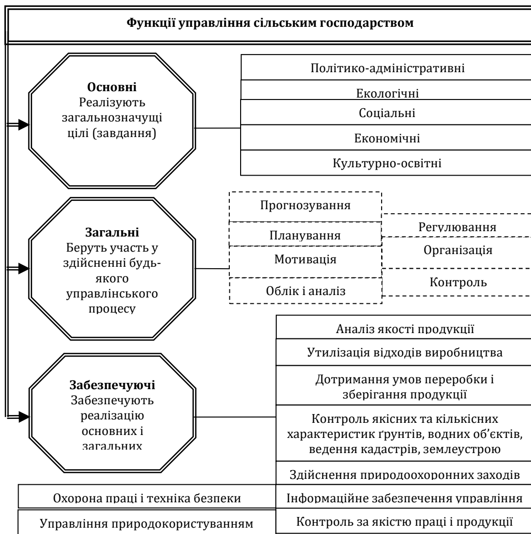
Рис. 2. Класифікація функцій управління сільським господарством

Отже, відповідно до перерахованих завдань, всі функції управління сільським господарством можна класифікувати на основні, загальні та забезпечуючі (рис. 2).