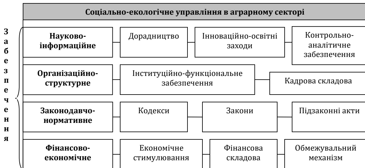
Рис. 3. Забезпечення соціально-економічного управління в аграрному секторі

Соціально-екологічне управління в аграрному секторі потребує науково-інформаційного, організаційно-структурного, законодавчо-нормативного та фінансово-економічного забезпечення (рис.3).