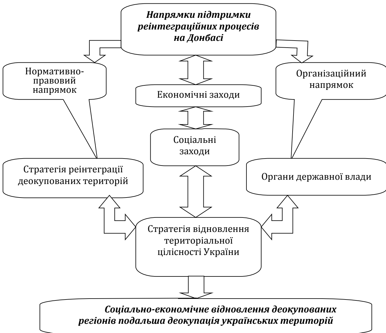
Рис. 2. Напрямки підтримки реінтеграційних процесів на Донбасі

Тривалі бойові дії призвели до значних людських жертв, спустошили міста і села, спричинили масові хвилі територіального переміщення населення як внутрішнього, так і за кордони країни. Кількість внутрішньо переміщених осіб зростала практично рівномірно, крім стрибків у період ускладнення воєнних дій, а саме грудень 2014 - лютий 2015 рр., коли кількість ВПО зросла на 493 902 осіб. Середньомісячна кількість переміщених із зони проведення антитерористичної операції осіб за даний період складає 10 000 осіб [18].