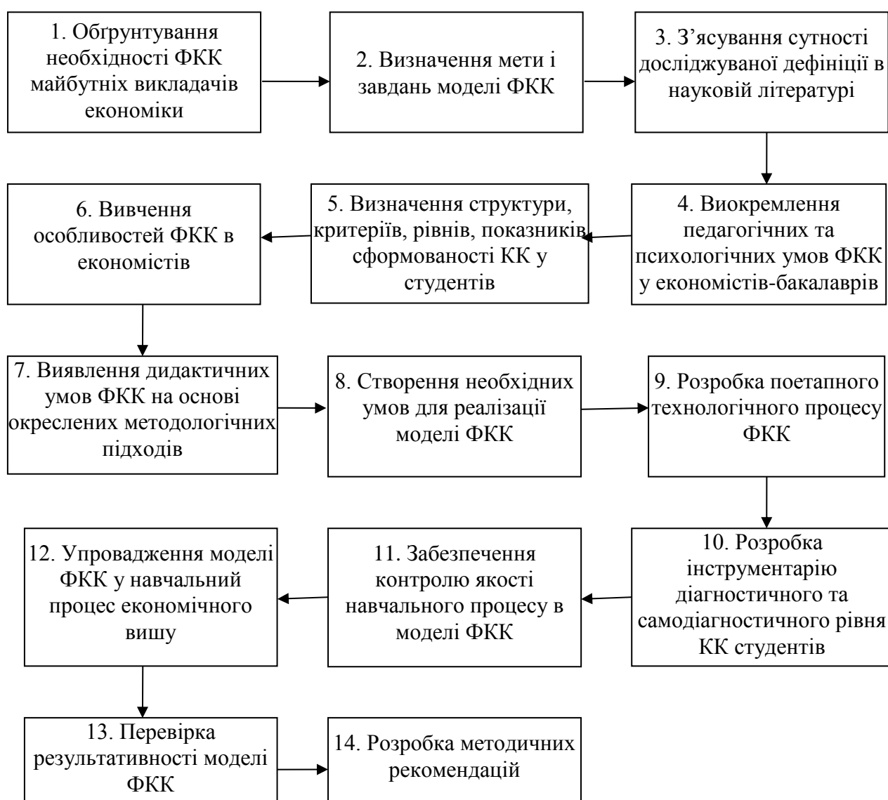
Рис. 1. Поетапна стратегія реалізації моделі формування комунікативної компетентності економістів

Оскільки основними формами організації навчальної діяльності у ВНЗ є аудиторні лекційні, практичні заняття, самостійна та індивідуальна робота студентів, характер комунікативної компетентності зумовлює впровадження в освітній процес поруч із традиційними таких активних методів навчання: проблемних (проблемного викладання, частково-пошукового, дослідницького), ігрових (ділові ігри, дискусії).