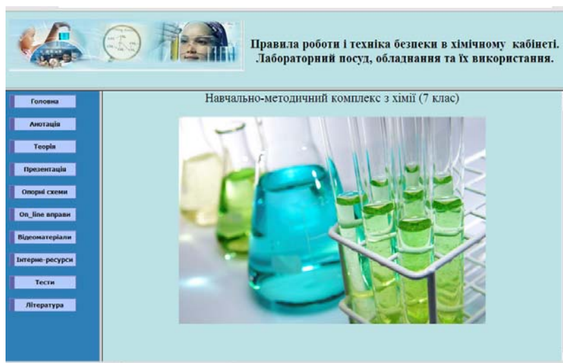
Рис. 2. Структура веб-сторінки методичного забезпечення уроку

Найвагомішими з методичної точки зору є розробки уроків, які мають однакову структуру та авторський дизайн. Кожний урок розроблено у вигляді окремої веб-сторінки, яка містить фреймову структуру та інтерактивні кнопки (рис. 2).