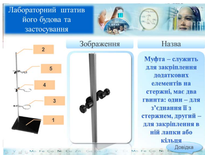
Рис. 3. Інтерактивний плакат для вивчення будови лабораторного штатива

організації навчального процесу (рис. 3).