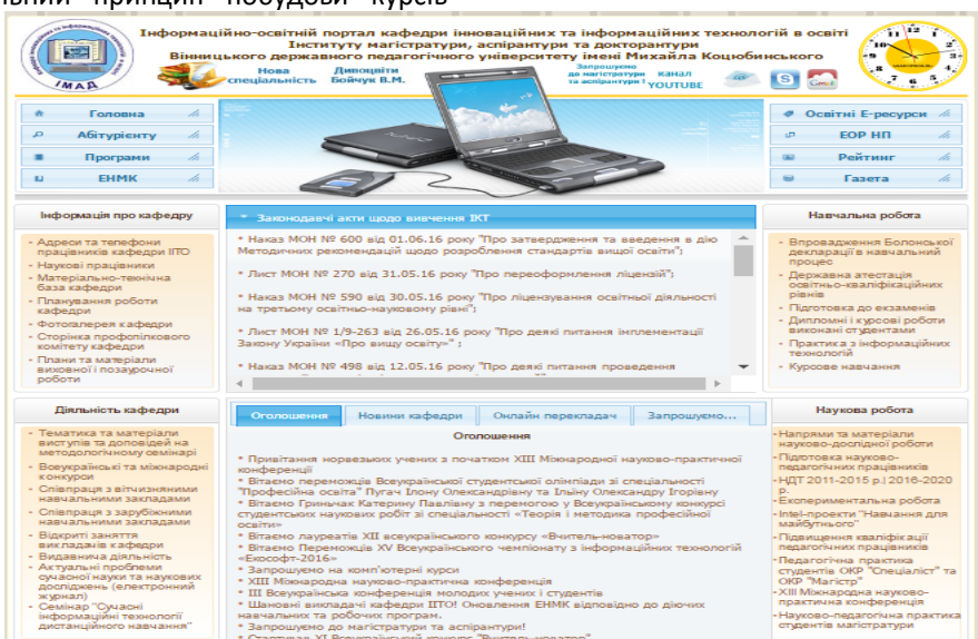
Рис. 1. Вигляд головної сторінки порталу кафедри інноваційних та інформаційних технологій в освіті

Викладачами кафедри інноваційних та інформаційних технологій в освіті Вінницького