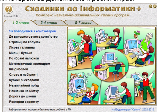
Рис. 1. Комп'ютерна програма «Сходинки до інформатики Плюс»

Широкі можливості для формування інформаційної культури молодших школярів мають уроки предмету «Сходинки до інформатики». На цих уроках молодші школярі набувають навичок роботи з комп'ютером за допомогою ігрових вправ.