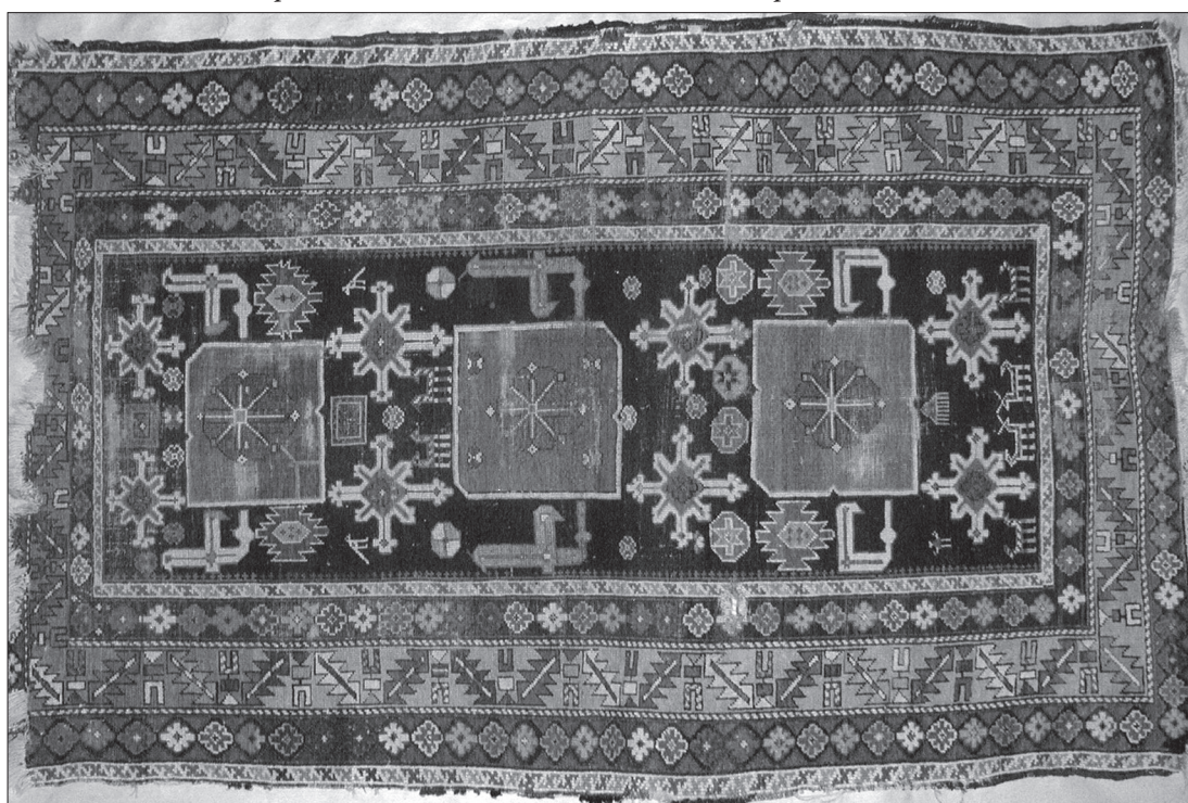
Килим “Тарагашли” – три квадратні медальйони. Тип Губа-Ширван. Азербайджан, кінець XIX ст. Вовна, ворсове ткацтво.