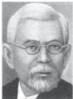
Д. І. Багалій