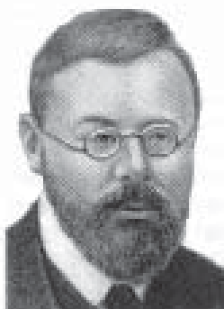
М. І. Туган- Барановський