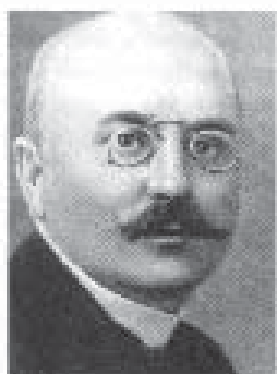
Ф. В. Тарановський