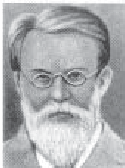
В. І. Вернадський