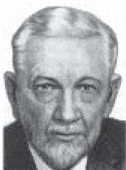
С. П. Тимошенко