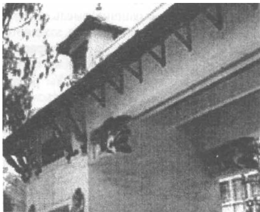
Білі ворота Катманду

Непальські пагоди-дега на Дарбар-сквері – чудовий “храмовий сад”. Маленькі чарівні одно- або двох’ярусні пагоди і великі храми, такі як храм Таледжу або Шиви (Маджу-дега), можна роздивлятися годинами. Це й прекрасне місце відпочинку для мандрівника – на сходах цегляної основи храмів.