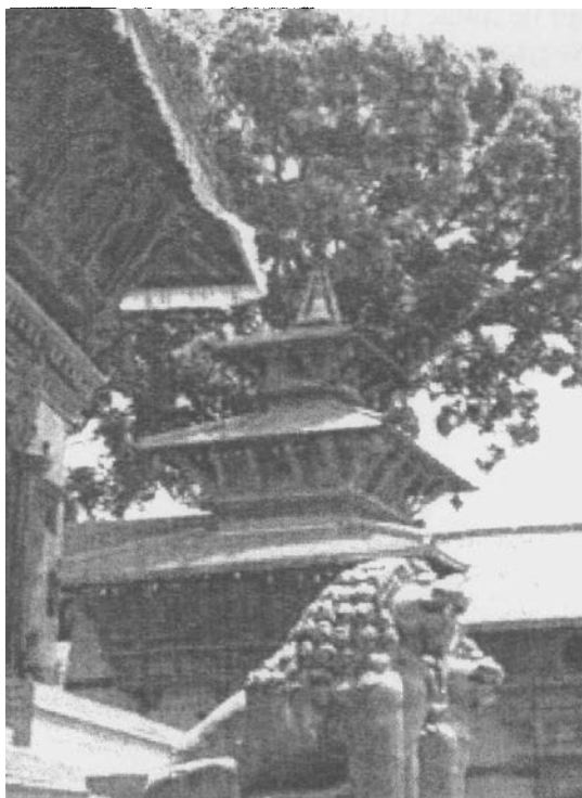
Непальські леви на Дарбар-сквер

Такі перетинає ворота, і я опиняюся в пробці на досить вузькій вулиці, що веде до Дарбар-скверу, центральної площі. Непальський рух на вулицях старого міста може здивувати західну людину ірраціональністю: це скоріше броунівський рух, аніж упорядкований (хоча офіційно рух у Непалі лівосторонній). Водії машин вважають обов'язковим постійно сигналізувати, а люди в сарі, чи в традиційному неварському вбранні, чи одягнуті дуже сучасно, чоловіки – в традиційних непалітопі (головний убір), рухаються навпростець, обходячи машини і мотоцикли, діти поспішають перебігти переповнену вуличку. Тут же можна зустріти господаря з козою, що також поспішає на інший бік у провулок, а священна корова миролюбно лежить посеред проїжджої частини і не залишає водіям іншого вибору, як просто об'їхати себе. На одній старовинній вулиці, що веде від Дарбару у туристичний район Тамель, я також помічав, що, незважаючи на вузькість середньовічного планування вулиці, рух в усіх напрямках продовжується, але це зовсім не заважає немолодому непальцю моли-