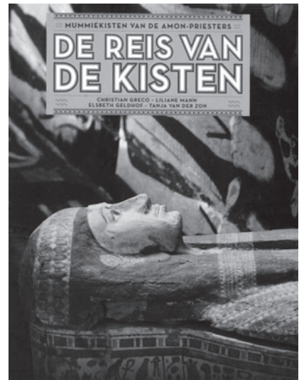
Мал. 1. Обгортка каталогу виставки “Саркофаги жерців Амона. Подорож саркофага”

Організатором конференції став “Ватиканський проект із саркофагів” ( Vatican Coffin Project ), що об’єднав науково-реставраційні центри Ватикану (Діагностична лабораторія консервації та реставрації Департаменту Стародавнього Єгипту та Близького Сходу музеїв Ватикану) та реставраційні центри Лувру (Париж, Франція) і Національного музею старожитностей у Лейдені (Нідерланди). Роботи конференції було приурочено до відкриття виставки “Саркофаги жерців Амона. Подорож саркофага” (“ Mummiekisten van de Amon-Priesters. De Reis van de Kisten ”) [Greco, Mann, Geldnof, van der Zon 2013], що пройшла 20 квітня – 15 вересня в Національному музеї старожитностей у Лейдені, на якій представлено експонати з трьох вищезазначених музеїв (мал. 1). Відзначимо й такий факт, що Пошта Ватикану випустила спеціальну поштову листівку з нагоди цього заходу (мал. 2).