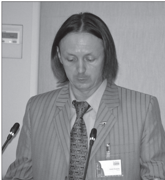
Мал. 5. Доповідь співробітника Інституту сходознавства ім. О. Тарасенка. 21 червня 2013 р.