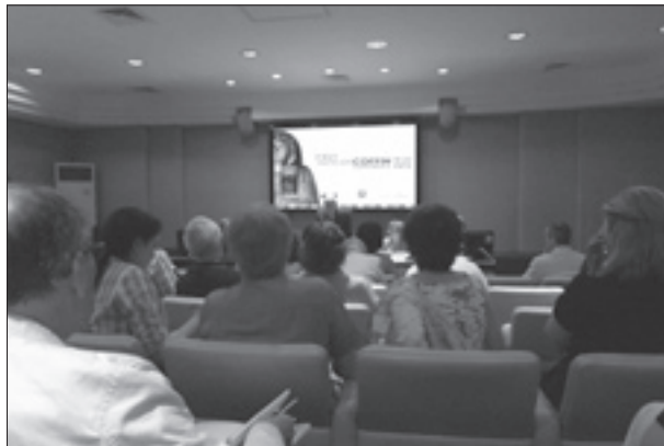
Мал. 3. Урочисте відкриття конференції. 19 червня 2013 р.

Перша ранкова секція 19 червня мала назву “Третій перехідний період: розвиток і значення поховальної практики” (“The Third Intermediate Period: development and significance of burial practice”) і пройшла під головуванням Ж. Андре-Лєно (Париж) та Р. ван Вальсема (R. van Walsem). Було виголошено сім доповідей, з яких особливий інтерес викликали теми Дж. Тейлора щодо розвитку іконографії гендерних ознак