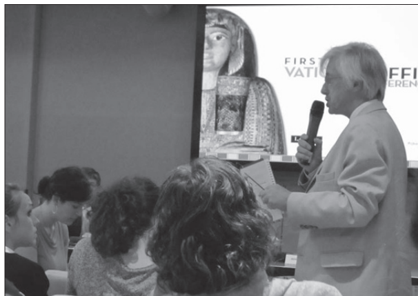
Мал. 4. Професор А. Нівінські (A. Niwiński) (Варшава) бере участь у дискусії. 19 червня 2013 р.