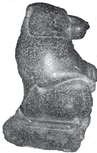
Лл. 3. Статуя павіана. Вигляд з правого боку.