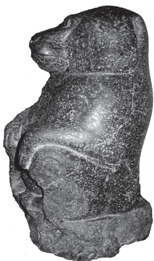
Лл. 2. Статуя павіана. Вигляд з лівого боку.