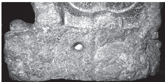
Лл. 5. Фрагмент підставки статуї павіана із просвердленим отвором спереду.