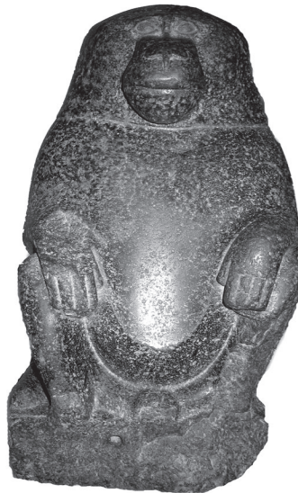
Іл. 1. Статуя павіана із Національного музею мистецтв імені Богдана та Варвари Ханенків (інв. Nr. 352 АТК).