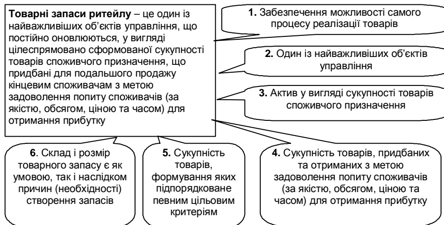
Рис. 1. Поняття та найважливіші сутнісні характеристики товарних запасів ритейлу.

Проведене дослідження зазначених та багатьох інших праць дозволило виділити основні характеристики товарних запасів і на цій основі сформулювати визначення товарних запасів ритейлу (рис. 1).