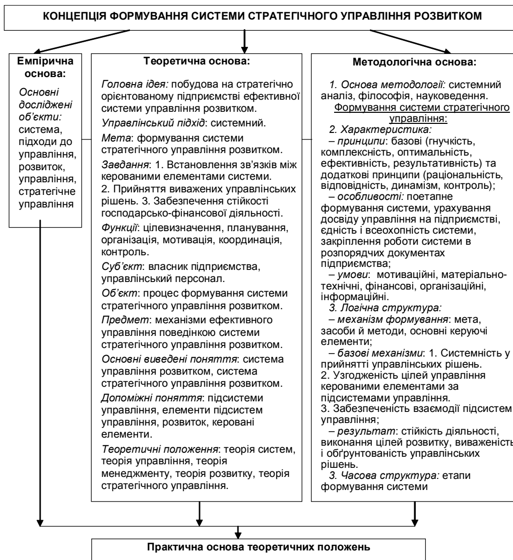
Рис. 1. Основні складові концепції формування системи стратегічного управління розвитком промислового підприємства.

Так, емпірична основа концепції дозволяє узагальнити існуючий досвід розв'язання проблем управління й розвитку підприємств та спирається на виведені й обґрунтовані наукові гіпотези, закономірності, твердження. Теоретична основа на базі емпіричних знань є сукупністю сформульованих понять, що розкривають ідею формування концепції та дозволяють пояснити розвиток емпіричних закономірностей. Методологічна