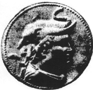
Рис. 1: Монета Деметрія (збільшено)