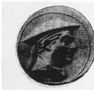
Рис. 2: Монета Антімаха (збільшено)