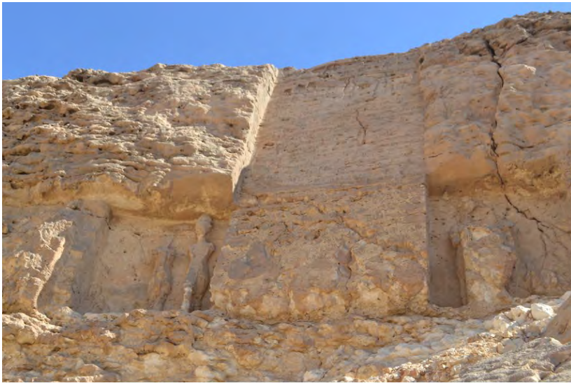
Рис. 6. Прикордонна стела U (фото автора, 2016 р.)

З вересня 2006 р. виходить періодичний журнал “ Horizon. The Amarna Project and Amarna Trust newsletter ”, у якому публікуються нові археологічні знахідки та архівні матеріали. У 80-х рр. ХХ ст. на базі Дослідницького комітету при Американському Філософському товаристві був створений проект із дослідження прикордонних стел Тель-ель-Амарни. Цей проект очолив єгиптолог В. Мюрнейн. Протягом 6 тижнів команда Мюрнейна копіювала тексти та фотографувала стели на обох берегах Нілу. Результатом цієї експедиції стала праця “ The Boundary Stelae of Akhenaten ” з ієрогліфічними текстами усіх наявних на сьогодні стел та їхнім перекладом англійською мовою [Murnane, van Siclen 1993]. Цей проект є необхідним для збереження текстів прикордонних стел, адже стели постраждали від природної ерозії та від рук людини. Н. де Г. Девіс зазначив у своїй монографії 1908 р., що стела Р була підірвана кілька років тому коптами, які вважали її входом до печери скарбів. Також він зазначив, що краще за інших збереглася стела S (рис. 5) [Davies 1908, 27]. Деякі стели розрізали на шматки і вивозили з країни для продажу. Фрагменти стели R, наприклад, були куплені в 1940 р. для Лувру. Згодом схожа доля