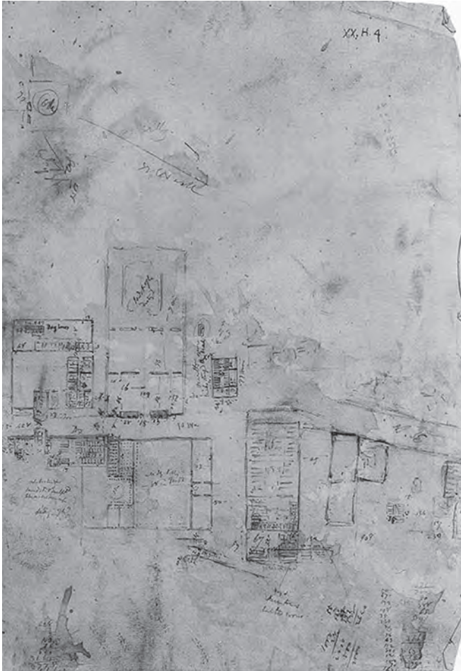
Рис. 1. План міста Ахетатона, зроблений Д. Г. Вілкінсоном у 1826 р. (оригінал зберігається в Бодліанській бібліотеці Оксфордського університету)

описав місцевість біля Нілу під назвою Туна-ель-Гебель та одну з прикордонних стел (стела А) [Reeves 2005, 14]. Вперше план міста був зроблений за часів експедиції Наполеона в 1789 р. й опублікований у виданні “ Description de l'Égypte Antiquités ” [Description... 1817, pl. 63.2].