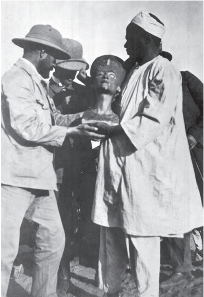
Рис. 4. Відкриття бюста цариці Нефертіті в Тель-ель-Амарні експедицією Л. Борхардта 6 грудня 1912 р. 3