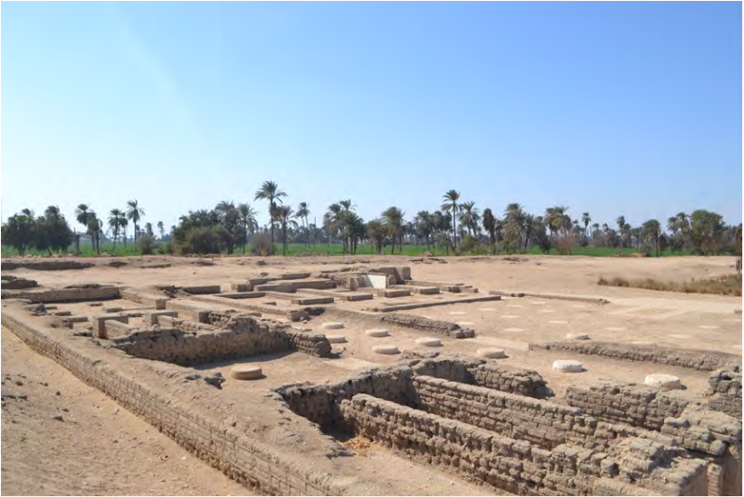
Рис. 7. Руїни Східного палацу в Тель-ель-Амарні

Аменхотепа IV [Gohary 1992]. У 2002–2003 рр. розкопки продовжував Е. Брок, однак значних знахідок вже не було.