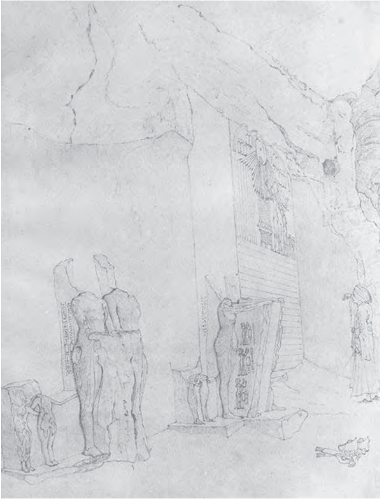
Рис. 3. Прикордонна стела А за малюнком Роберта Хей, 1827 р. [Davies 1908, Pl. XLIII]

цю стелу змалював у 1827 р. Р. Хей (рис. 3) та згадували такі єгиптологи, як Р. Лепсіус та Ж. Дарессі [Daressy 1893, 52–62]. Стела U, що розташована біля Північних гробниць, була відкрита в 1840 р. єгиптологом Д. Гліддом. П'ять прикордонних стел згадує у своїй монографії німецький єгиптолог А. Відеманн [Wiedemann 1884, 396–403].