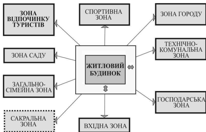
Рис.1. Узагальнююча схема зонування біфункціональної садиби (на основі натурального обстеження).

Підприємницька зона у біфункціональній садибі включає готельну у будинку та зону відпочинку туристів на території садиби (рис.1).