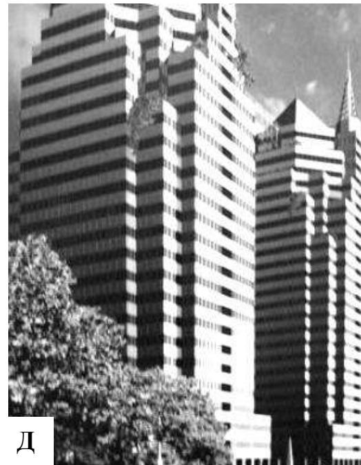
Рис. 2 Техноцентричний підхід до формування зовнішнього вигляду сучасного багатоквартирного міського житла.

А - «Башта 100» в м. Нью-Йорк, США.; Б – Житловий комплекс в м.Чанг Хо, Тайвань; В – Житловий будинок в м. Бомбей, Індія; Г – Проект житлового комплексу між вул. Ямською, Боженко і Лабораторною в м. Києві; Д - Проект житлового комплексу "Башти близнюки" в м. Дніпропетровськ.