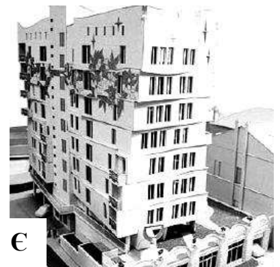
Рис. 3 Біоцентричний підхід до формування зовнішнього вигляду сучасного багатоквартирного міського житла.