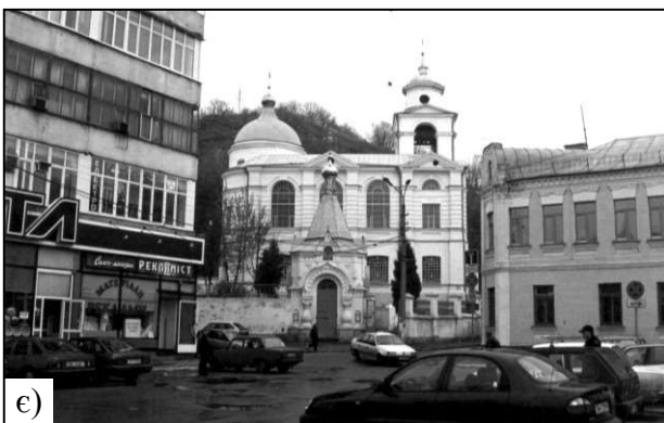
Рис. 1. Старовинні храми Києва: а) Андріївська церква; б) Вознесенська церква Києво-Печерської лаври; в) Воскресенська церква Києво-Печерської лаври; г) Миколая Набережного церква; д) Миколая Притиска церква; е) синагога; е) містобудівний ансамбль Воздвиженської церкви – наслідки ХХ ст.