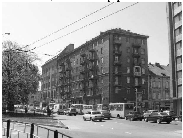
Рис. 4. Єдиний реалізований об'єкт нової міської площі Львова – будинок на пр. Чорновола, 7