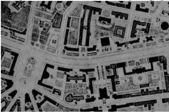
Рис. 1. Генплан відбудови Хрещатика

Повоєнні перетворення українських міст є яскравим прикладом реалізації містобудівних концепцій того часу. У кожному місті був втілений свій варіант формально-просторової мови містобудівного соцреалізму, що зумовлювалося конкретними умовами проектування, а також характером та масштабами руйнувань. Таким чином, у Києві вдалося створити монументальну «головну вулицю», яка стала еталоном формування головного міського простору; у Львові містобудівельні трансформації, які передбачали серйозну зміну містобудівної структури історичної частини міста (оскільки під час війни місто практично не постраждало), обмежилися лише фрагментарними реалізаціями і залишилися на папері як пам'ятки теоретичного осмислення утопії; у Дніпропетровську був реалізований композиційно-образний принцип «відкритості» міста та зв'язку з природою.