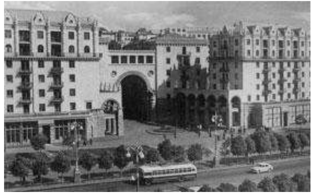
Рис. 2. Архітектура Хрещатика 1950-х років – «соціалістична за змістом, національна за формою»