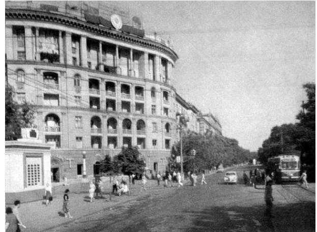
Рис. 6. Забудова 1950-х років головної вулиці Дніпропетровська – проспекту Карла Маркса