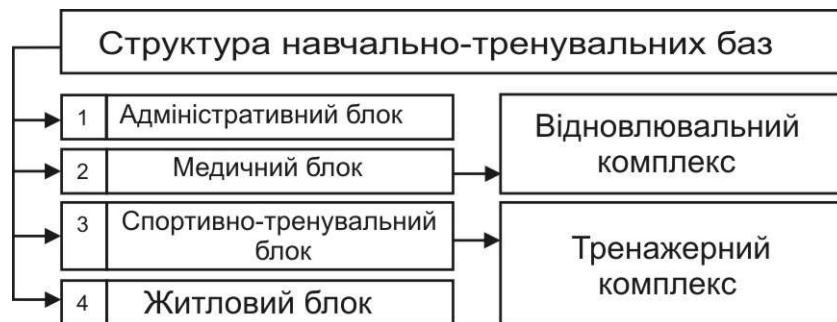
Рисунок 1. – Схема функціональної структури типової НТБ в Україні.

Спільним для всіх типів НТБ є наявність таких функціональних блоків: адміністративного, медичного, житлового, допоміжного, відновлювального (включає фізіотерапевтичний комплекс, відділення трансфузіології та еферентної терапії, SPA-блок, рис.1 і 2).