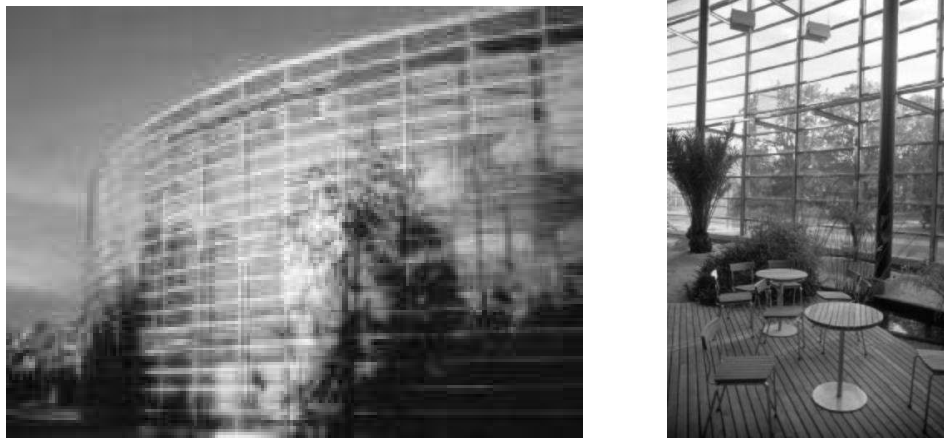
Рис. 7. Бібліотека в університетському комплексі Гельсінкі

Будівля комплексу нового університету в Гельсінкі побудована на темі інтегрування природних форм в структуру бібліотечного простору. У даному випадку для розміщення фрагментів живої природи в інтер'єрі використаний досить виразний прийом. Крізь засклону дзеркальну поверхню фасаду бібліотеки в університетському комплексі Гельсінкі видно контури рослинності внутрішніх зимових садів, що продовжують тему природи в самому будинку.