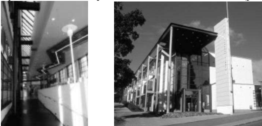
Рис. 5,6. Бібліотека в м. Віхта, Фінляндія.

Бібліотека для людей з обмеженими фізичними можливостями в місті Віхті, Фінляндія, демонструє простір читального залу, наповнений повітрям і світлом за рахунок поєднання верхнього та бокового осклення (рис.5).