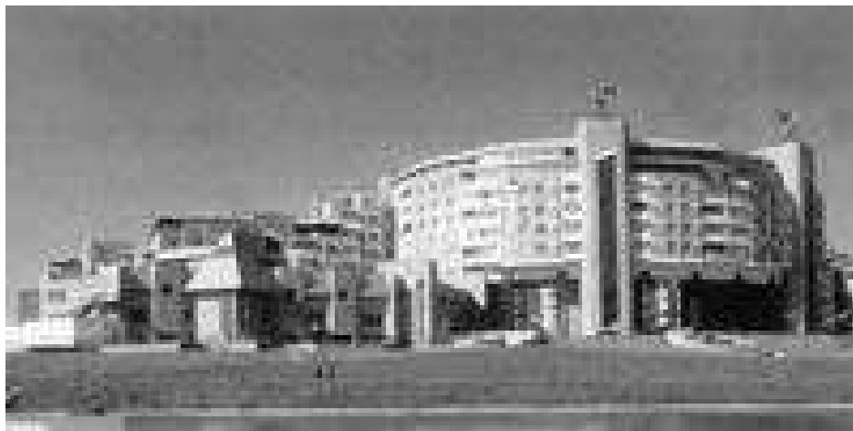
Рис. 6. Житловий комплекс «Синій Птах», Москва.

Житловий комплекс «Синій Птах», (Москва, 1997р.), розміщений в район комфортного проживання у 5-му мікрорайоні Північний Бутовий. Комплекс складається з житлових будинків змінної (4-10) поверховості та 22-поверхового будинку. Окрім житлових корпусів комплекс включає дитячий сад на 60 місць, школу із спортивним ухилом на 500 місць підземний двоповерховий гараж на 309 машиномісць, а також магазини, кафе і ресторани. (рис. 6). В цьому комплексі апробована схема створення забудовником кондомініуму.