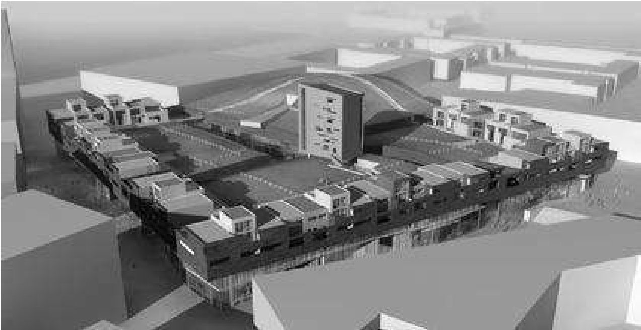
Рис. 5. Житловий комплекс «Блок 1», арх. К. де Портзампарк

Житловий комплекс «Синій Птах», (Москва, 1997р.), розміщений в район комфортного проживання у 5-му мікрорайоні Північний Бутовий. Комплекс складається з житлових будинків змінної (4-10) поверховості та 22-поверхового будинку. Окрім житлових корпусів комплекс включає дитячий сад на 60 місць, школу із спортивним ухилом на 500 місць підземний двоповерховий гараж на 309 машиномісць, а також магазини, кафе і ресторани. (рис. 6). В цьому комплексі апробована схема створення забудовником кондомініуму.