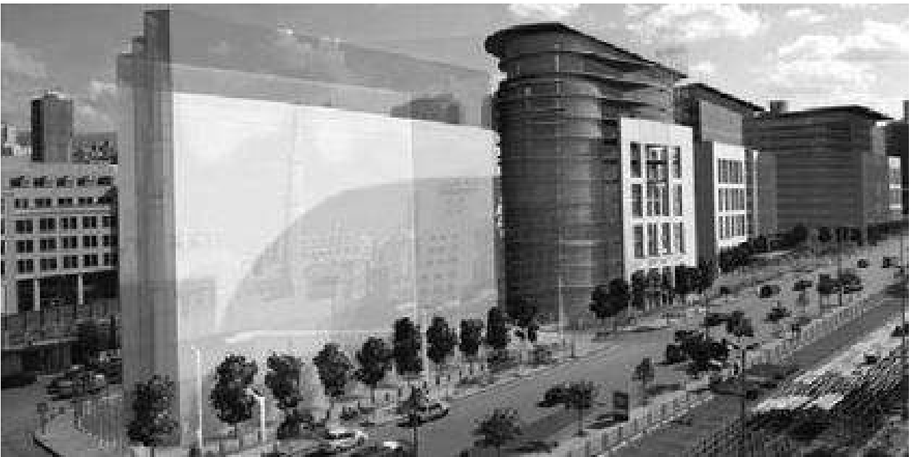
Рис. 4. Житловий комплекс «Ворота Бейруту» у Лівані, арх. К. де Портзампарк, арх. майстерня «Архітектоніка».