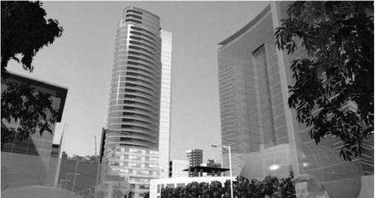
Рис. 3. Житловий комплекс «Ворота Бейруту» у Лівані, арх. К. де Портзампарк, арх. майстерня «Архітектоніка».

житловим будинком у центрі. Дах цього квадрата засаджений газоном, межі якого формуються рядами секційних будинків (рис. 5).