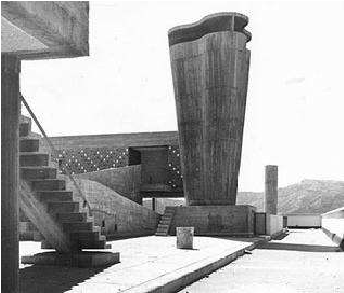
Рис. 2. Житловий комплекс в Марселі, арх. Ле Корбюзьє (на покрівлі).

Наприкінці 60-х років ХХ століття у Франції піднялася хвиля протестів проти основного принципу розміщення масового житла - тріади (метро, місце праці, житло). Надалі держава відмовилася від створення великих ансамблів, що охопили Францію на той час, на користь ідеї нового міста розробкою яких активно велася архітекторами.