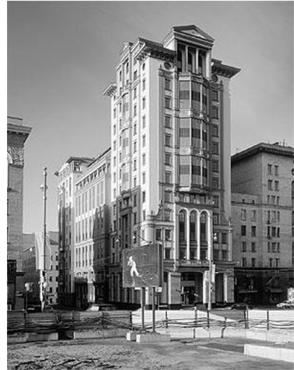
Рис. 8. Адміністративний будинок на вул. Перша Тверська-Ямська у Москві

Будівельна компанія «Спец-Высот-Строй» 2000 – 2003 рр.