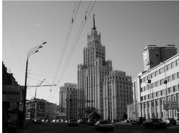
Рис. 2. Адміністративна споруда біля станції метро «Красные ворота» у Москві

арх. А.Душкін, Б.Мезенцев, В.Абрамов, 1953 р.