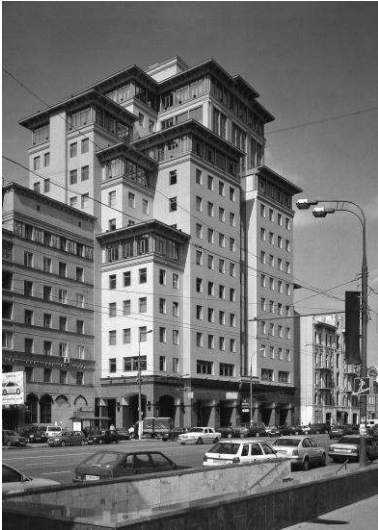
Рис. 6. Адміністративний будинок на Долгоруківській вулиці у Москві

Моспроект – 2, арх. П. Андрєєв, В. Ковшель, В. Солонкін, 2000 – 2001 рр.