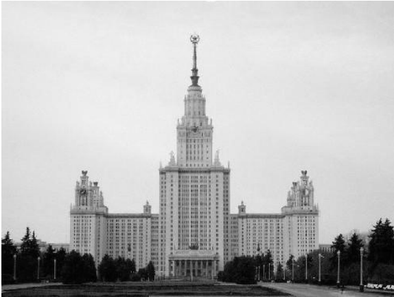
Рис.1. Спорда Московського державного університету на Воробйових горах у Москві арх. Л.Руднев, С.Чернишов,

вулиць і на вигинах Москви-ріки – на найважливіших планувальних вузлах. Проте, роль висотних споруд була набагато важливіша, ніж просто містобудівельна домінанта. В СРСР висотні будинки стали предметом ідеології. Помпезність, орієнтація на вічність, театральність і натхненність втілювали ідеї комуністичної квазірелігії. Символічною була присутність російської історії в їх архітектурі. Сталінські висотки стали символом домінування Москви, метафорою могутності надімперії [3].