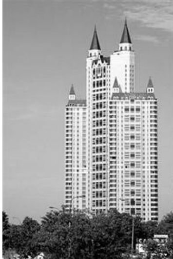
Рис. 7. Житловий комплекс «Едельвейс» у Москві

Моспроект – 2, арх. П. Андрєєв, В. Ковшель, В. Солонкін, 2000 – 2001 рр.