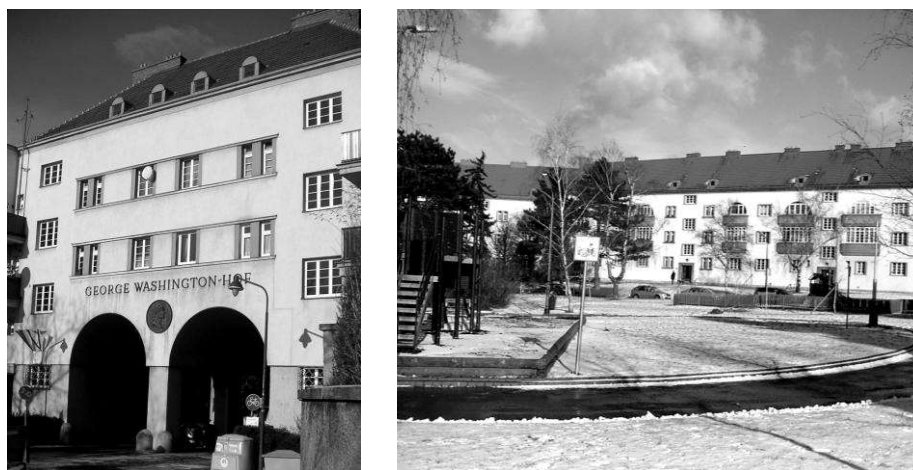
Рис. 2. Джордж-Вашингтон-Хоф, м. Відень, Австрія, 1927-1930 рр

1 – загальний вигляд; 2 – фасад; 3 – план секції; 4 – генплан.