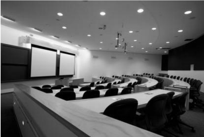
Рис. 7 Универсальная аудитория в библиотеке Принстонского университета (США)

Важной составляющей современной университетской библиотеки является информационный узел, в который входят телестудия, радиоузел, издательский сектор. Главную роль в формировании среды здесь играет технологическое оборудование, которое должно сочетаться с архитектурными решениями.