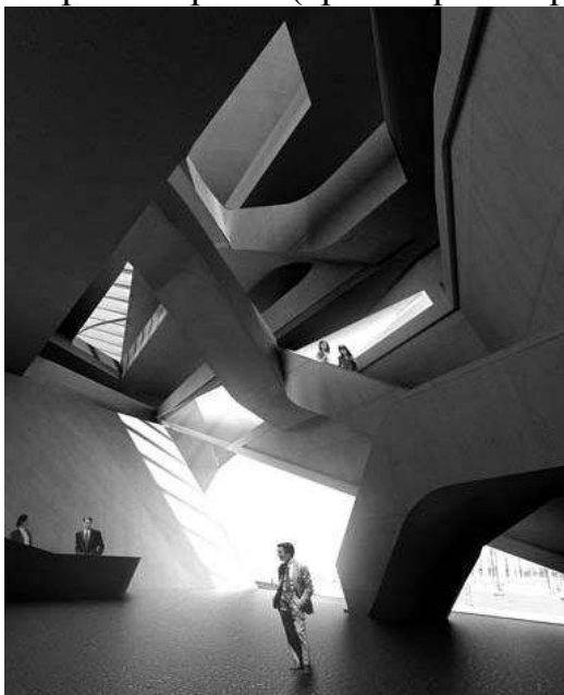
Рис. 10 Внутреннее пространство библиотеки Севильского университета

Другие авторы, во избежание таких ошибок, на первое место при проектировании зданий университетских библиотек ставят не концептуальные решения, а рациональность и функционализм. В результате, рождаются проекты быть может не столь эффектные, как у «футуристов», но очень эффективные и логичные. При этом архитектурно-художественная сторона таких сооружений, может не уступать ультрасовременным концептуальным постройкам. Такой рациональный подход реализован в проектах библиотек университетов в Портсмуте (арх. бюро Penuore & Prasad), Варшаве (арх. Марек Будзинский и Збигнев Бадовский), а также в здании библиотеки университета Кюри в Париже (арх. бюро Périphériques Architectes).