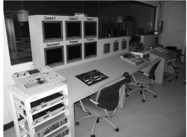
Рис. 8 Телестудия в библиотеке университета в Коэрновике (Мексика)

Большое значение при проектировании интерьеров библиотечных зданий придается состоянию общей визуальной среды (цветность, насыщенность зрительными элементами и др.).