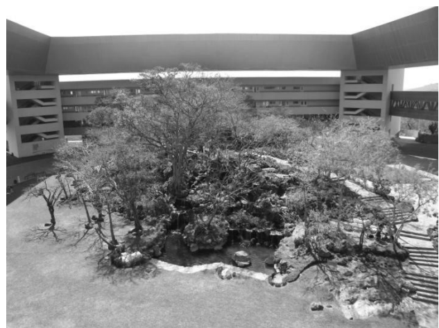
Рис. 4 Внутренний двор при библиотеке университета в Коэрновике (Мексика)