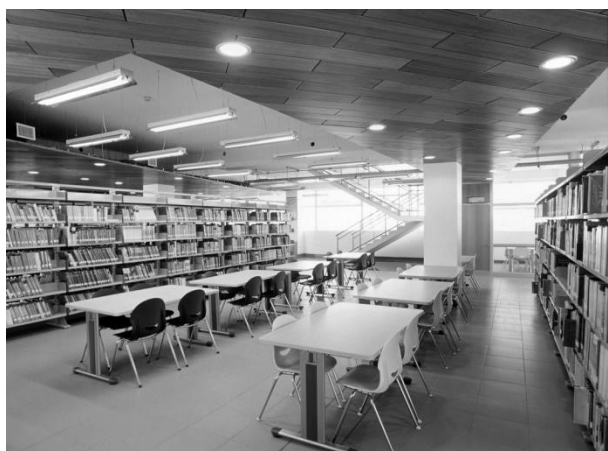
Рис. 1 Читальный зал открытого доступа в библиотеке Северного католического университета в Чили

Одной из основных функциональных зон в университетской библиотеке является читальная зона. Однозначно жесткое разделение пространства на читальные залы с помощью стен и перегородок ушло в прошлое. Современные конструктивные решения дают возможность формировать внутреннее пространство библиотеки на основе свободной планировки. Таким образом, все большее значение при формировании функциональных зон приобретает оборудование, мебель, легкие раздвижные конструкции. А разделение тематических читальных залов возможно осуществлять с помощью «буферных» общественных пространств и зон отдыха.