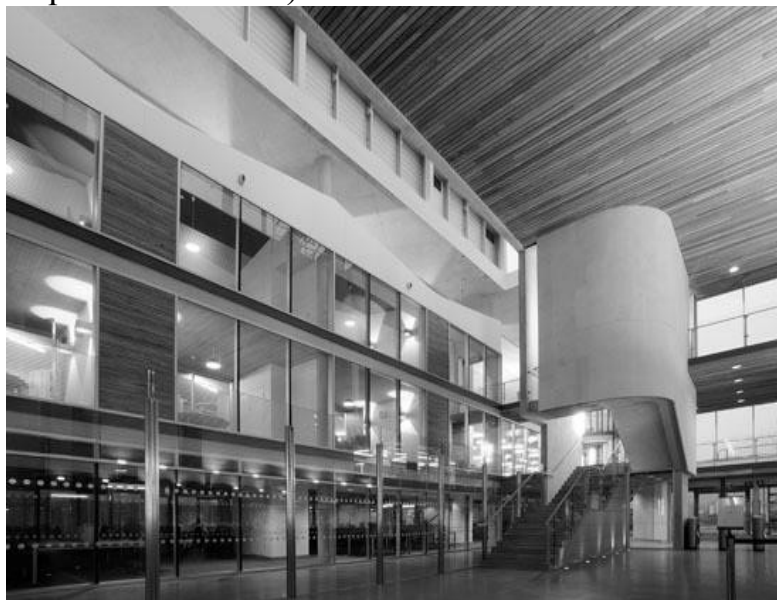
Рис. 11 Внутреннее пространство библиотеки в Портсмуте

При архитектурном проектировании современной университетской библиотеки необходимо придерживаться «золотой середины», то есть тщательно прорабатывать как идейную, концептуальную сторону проекта, так и функциональные особенности. Такой подход позволит сформировать современную качественную архитектурную среду, привлекательную и функционально оправданную.