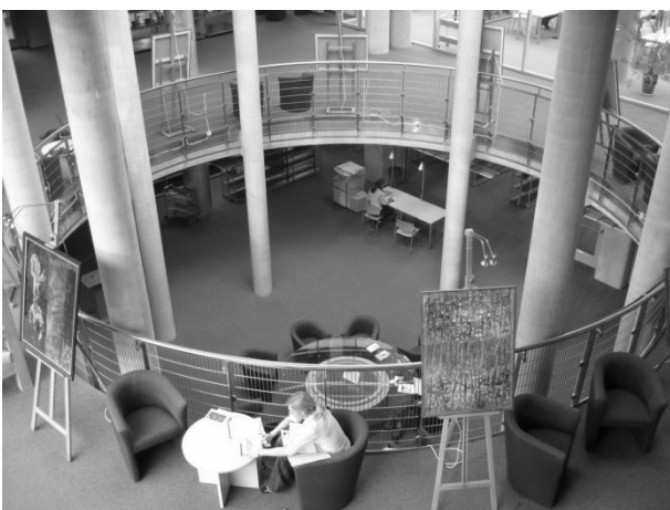
Рис. 3 Коммуникативно-экспозиционное пространство в библиотеке Варшавского университета (Польша)