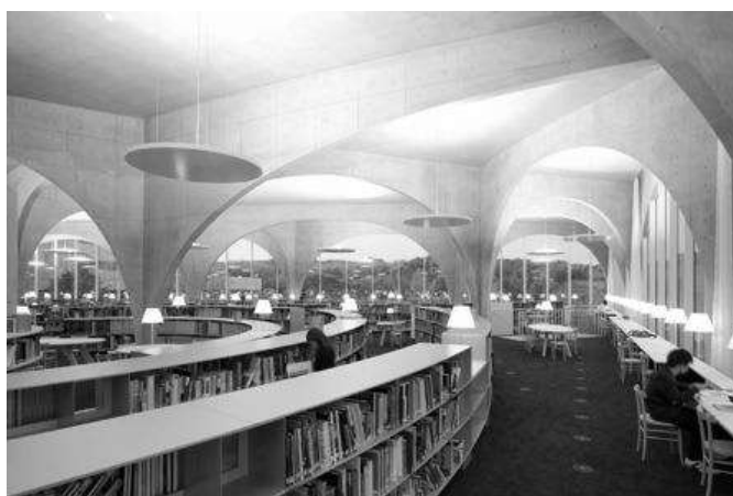
Рис. 2 Читальный зал открытого доступа в библиотеке университета искусств Тама в Токио (Япония)

Освещенность и ее изменение в разных функциональных зонах здания оказывает влияние на психофизическое состояние человека, во многом определяет его работоспособность и эмоциональный комфорт. Таким образом, грамотное использование освещения в структуре сооружения и интерьере может существенно повысить качество архитектурной среды.