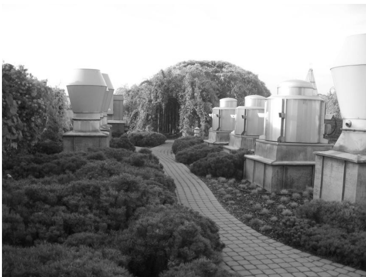
Рис. 5 Сад на крыше библиотеки Варшавского университета (Польша)

Растения в интерьере создают благоприятные условия для релаксации, что становится необходимым при длительной работе с книгами или за компьютером. Оптимальным считается равномерное «вкрапление» зон отдыха в пространство библиотеки. А зимний сад или озелененный атриум могут стать ярким акцентом или композиционным ядром в интерьере.