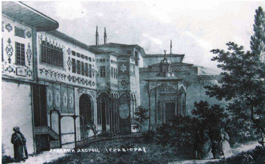
Рис. 2. Гравюра XIX века. Ханский дворец.

1 - Ворота на дворцовую площадь 2 - Хан-Джами (Главная мечеть) 3 - Главный двор 4 - Зал Дивана 5 - Гарем 6 - Кладбище с двумя погребальными часовнями