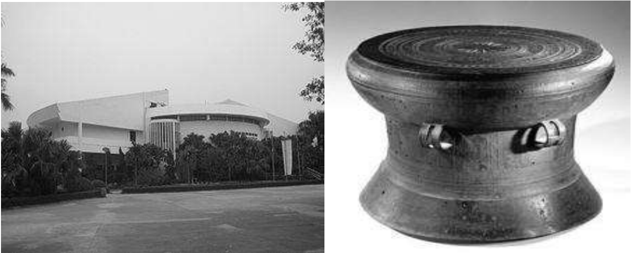
Рис. 2 Внешний вид входной части в музей и медный барабан Донг Шон. (Авторы проекта - народный архитектор Ха Дык Линг и французский архитектором Véronique Dollfus .)

Комплекс музея разделен на три части: первая – собственно здание музея, вторая - открытый парк с народными экспонатами на природе (включает в себе 10 разных архитектурных сооружений принадлежащих различным этнографическим группам), третья часть - Юго-Восточная Азиатская зона экспонатов, начавшая демонстрацию с 2008 года. Кроме перечисленного есть административная зона, включающая научный центр, библиотеку, складские помещения и зону реставрации экспозиции.