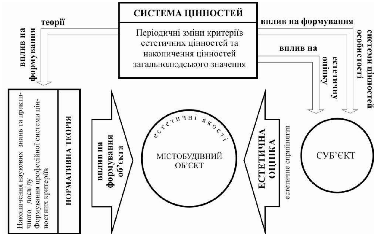
Рис.3. Взаємозв'язок системи цінностей з естетичними якостями міста

нормативних теорій, що визначають вибір цілей і засобів удосконалення міського середовища (рис.3).