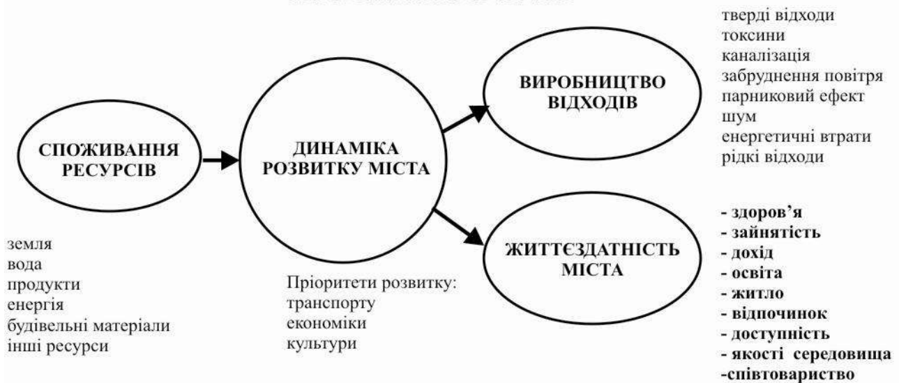
Рис.2. Сучасні нормативні теорії у містобудуванні: 2.1. Теорія досконалої форми міста К. Лінча (1981 р.); 2.2. Розширена метаболічна модель міських поселень (2000 рр.)