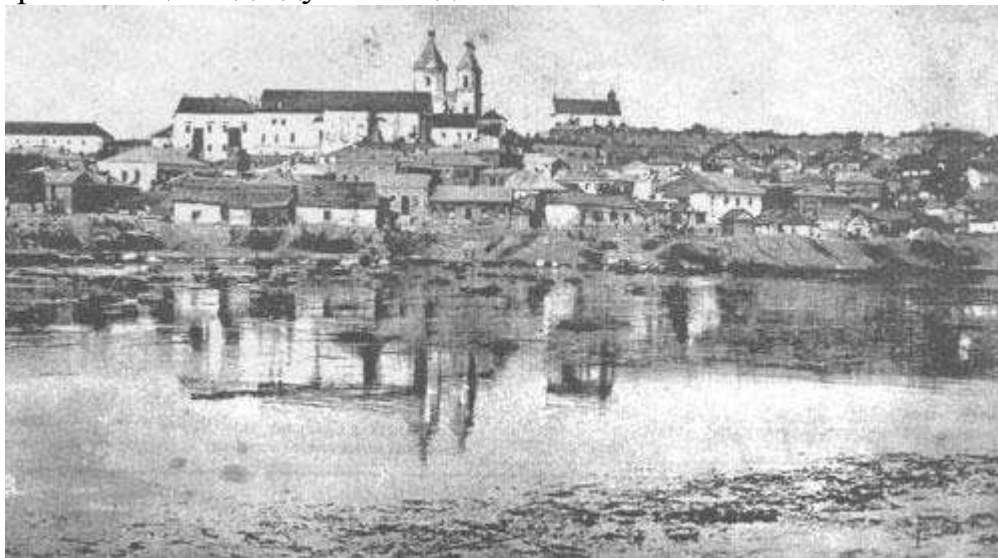
Вінниця, панорама міста. Фото початку ХХ ст.

1651 року козацькими полками під проводом славетного Івана Богуна. У 1643 та 1653 р.р. Вінницю відвідував Богдан Хмельницький.