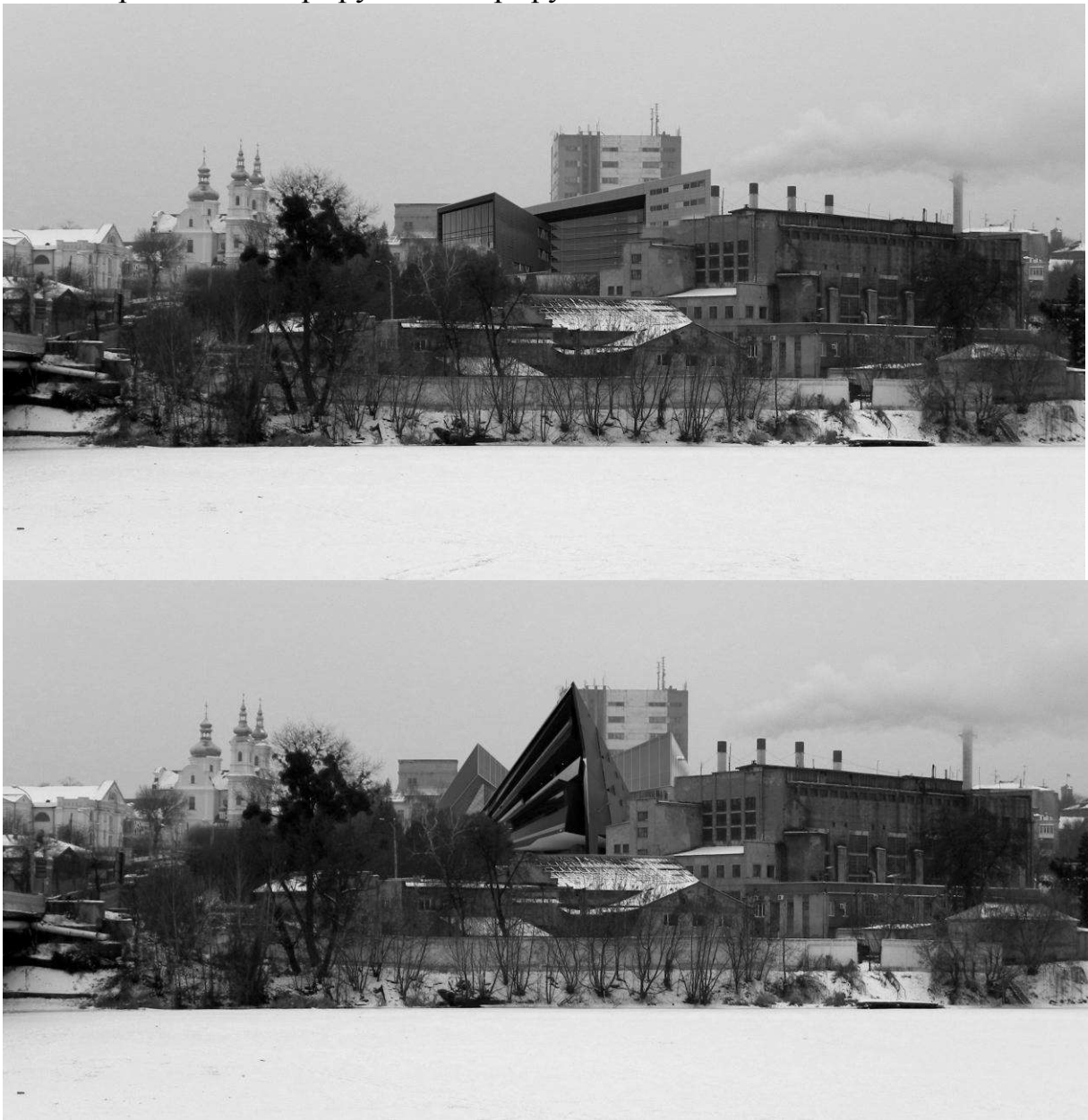
Два варіанти проектної пропозиції по реконструкції кінотеатру «Росія». Автор: дипломниця А.В. Петровська.

Провідну роль у пізнанні світу людиною має візуальне сприйняття. Саме тому просторове середовище повинне мати високу естетичну та інформативну цінність. Тому проблеми архітектурно-художньої виразності, пошуки нових композиційних прийомів в умовах сьогодення стають усе складнішими у зв'язку з перспективами динамічного розвитку і великими можливостями в сфері будівництва. Разом із економічним зростанням у місті підвищились вимоги населення щодо якості послуг, які включають в себе і архітектурні складові: неординарне композиційне рішення, зручне планування, цікаві художні вирішення інтер'єру та екстер'єру.