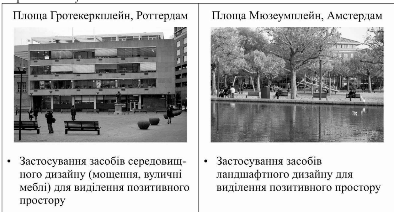
Рис. 4. Прийоми реалізації принципу акумулювання позитивного простору.

Повернення до традиційних типів міських просторів, що набуває все більшого значення, сьогодні здійснюється шляхом реалізації принципу акумулювання позитивного простору. Позитивним в сучасній західноєвропейській містобудівній літературі прийнято називати простір, що на відміну від відкритого перетікаючого простору має певні визначені межі [10]. Ці межі можуть визначатися як забудовою, так і засобами середовищного або ландшафтного дизайну. В досліджуваних містах акумулювання позитивного простору використовується здебільшого для створення затишних приватних ділянок на великих відкритих міських площах (як рекреаційні майданчики на Мюзеемплейн в Амстердамі). Однак, на площі Гротекеркплейн у Роттердамі цей принцип застосований з зовсім іншою метою – за допомогою малюнку мощення та розташування вуличних меблів підкреслюється традиційна компактна морфологічна будова простору міської площі (див. рис. 4). Таким чином в певній мірі цей прийом реалізовує принцип історичної наступності.