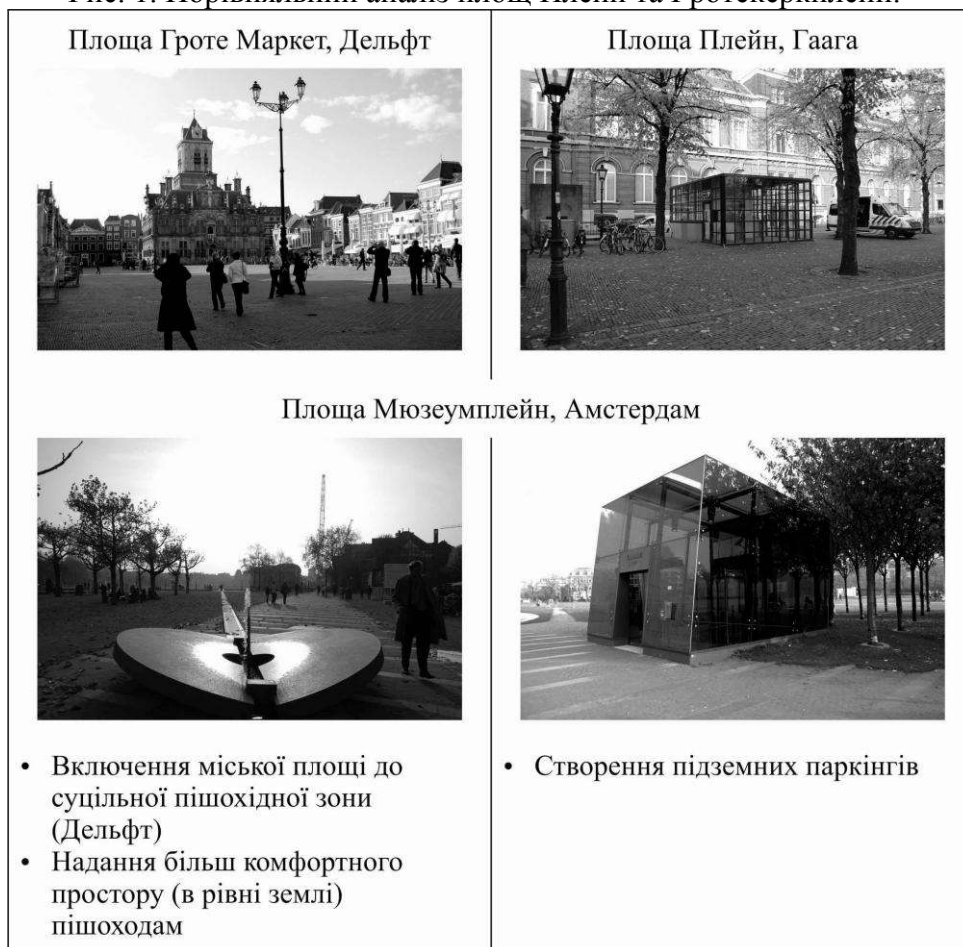
Рис. 2. Прийоми реалізації принципу організації транспортно-пішохідного руху з пріоритетом пішохода