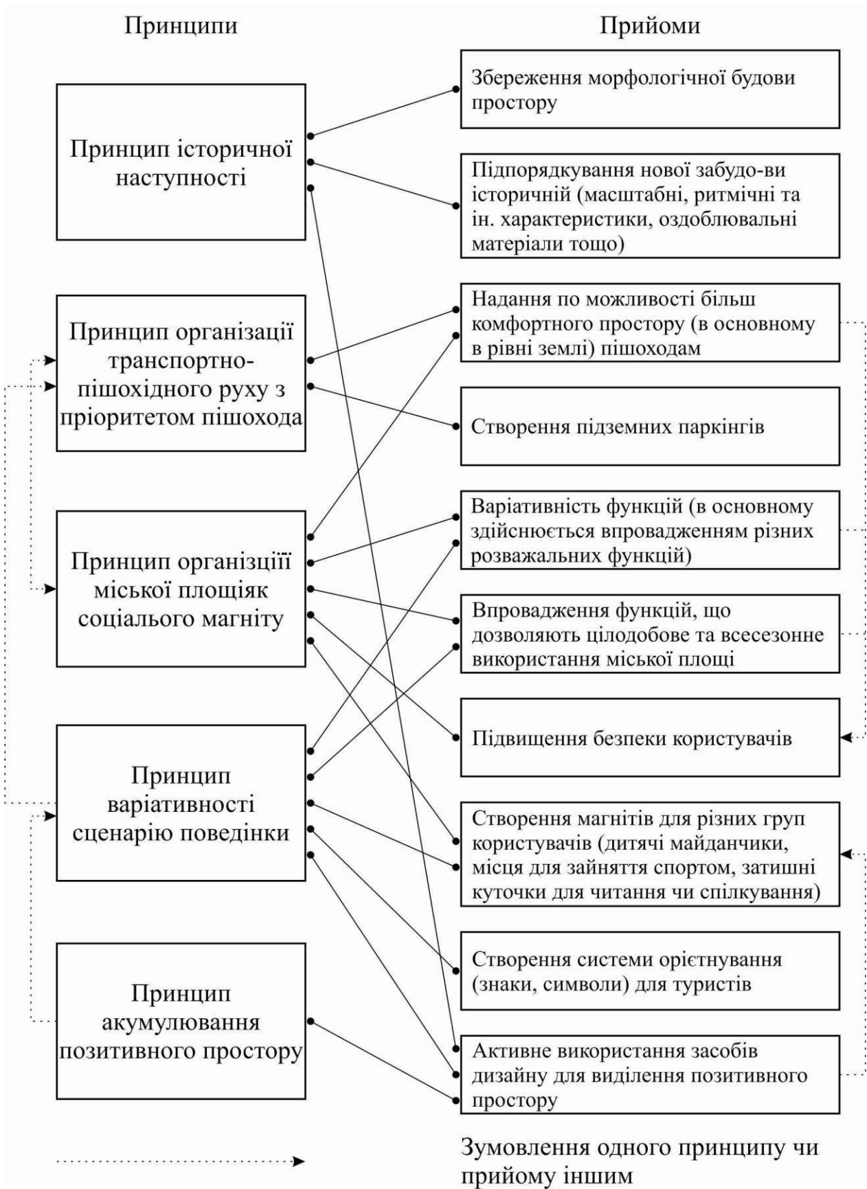
Рис. 5. Принципи та прийоми організації міських площ західноєвропейських міст (на прикладі міст Нідерландів)