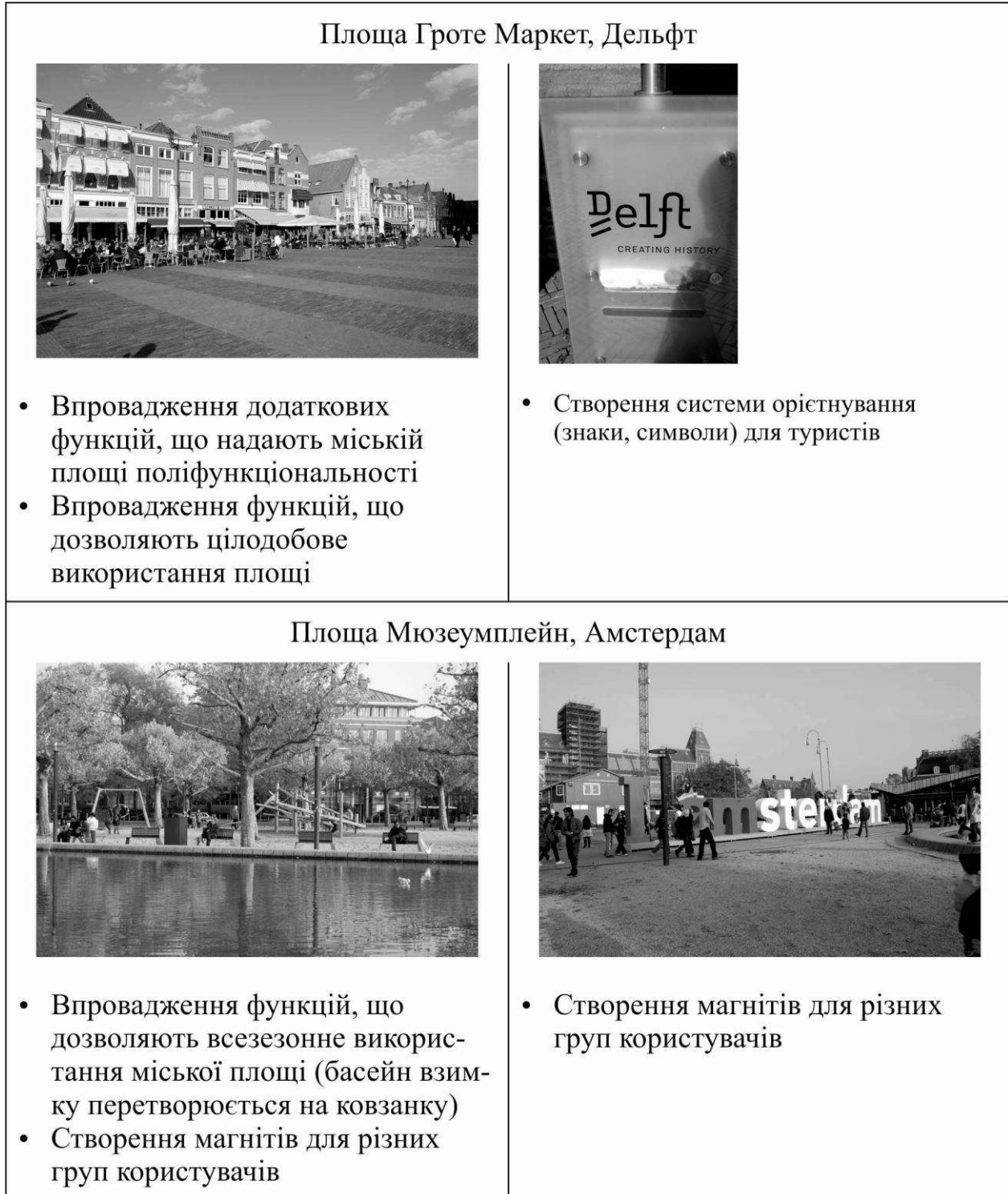
Рис. 3. Прийоми реалізації принципів організації міської площі як соціального магніту та варіативності сценарію поведінки для різних груп користувачів

Крім варіативності функціонального насичення та морфологічної будови різних ділянок відкритого міського простору, на сьогоднішній день проектна етика вимагає врахування інтересів таких специфічних груп користувачів, як маломобільні групи населення та туристи (див. рис. 3).