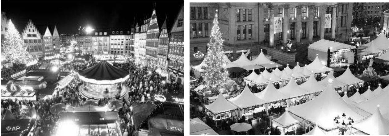
Рис.1. Щорічний різдвяний ярмарок у Франкфурті-на-Майні (а), у Берліні (б), Німеччина.

Інший аспект організації середовища для проведення святкових заходів в містах пов'язаний з періодичними потребами міст при проведенні національних свят, періодичних ярмарок та фестивалів, при організації святкової торгівлі або сезонному розширенні торгівлі, що проводиться через певні визначені періоди часу.