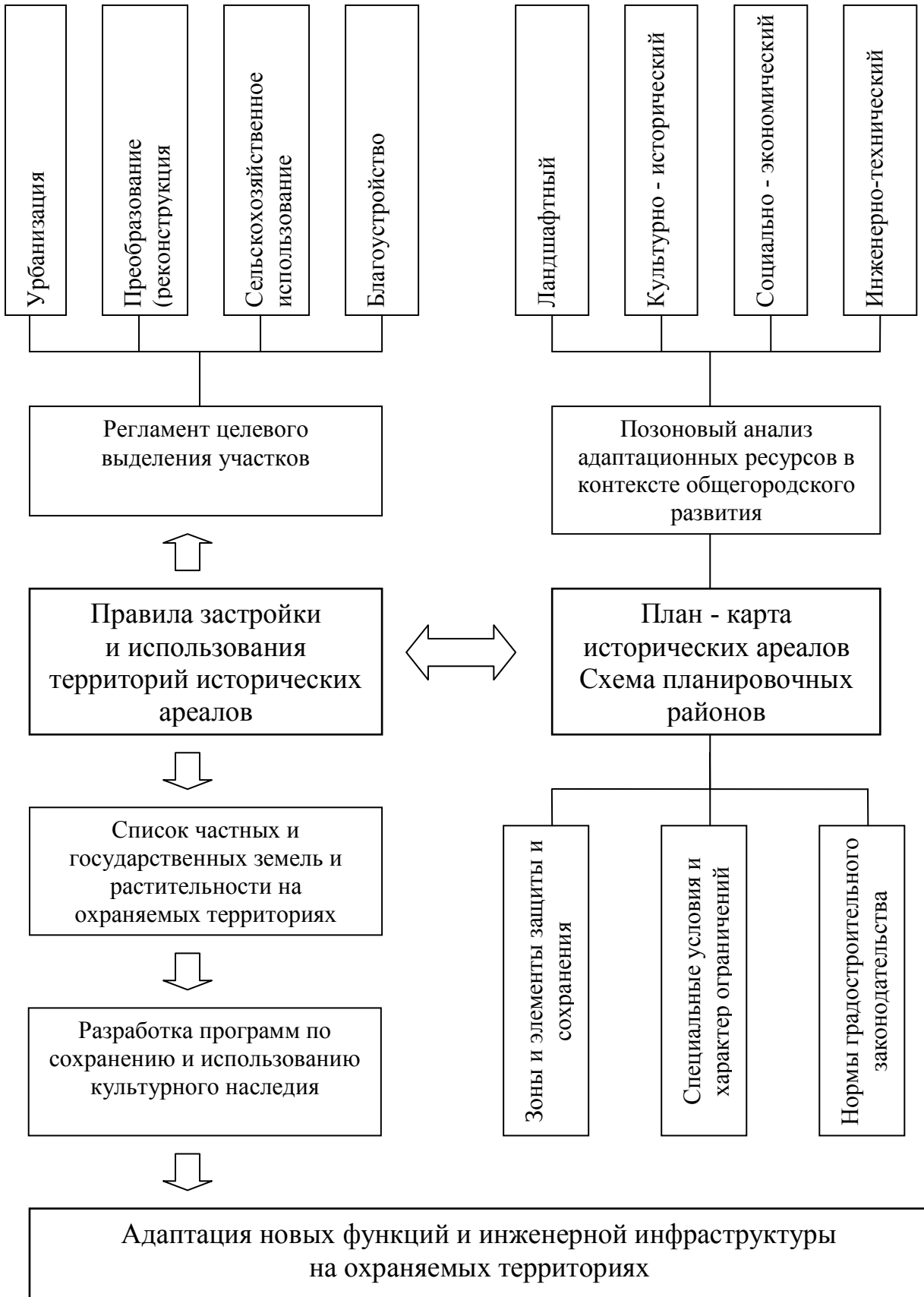
Рис.2. Организационно – управленческая модель сохранения и адаптации охраняемых территорий исторических городов