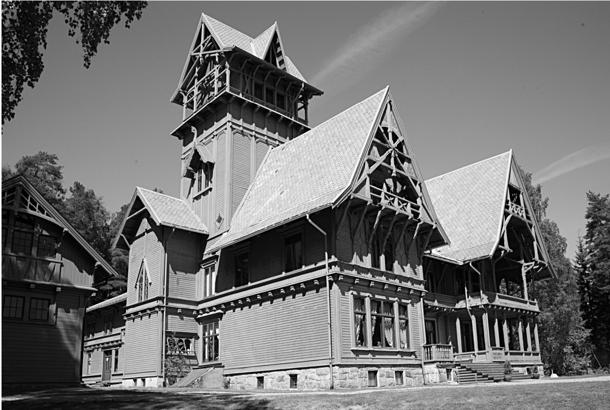
Рис. 1. Вілла „Фредгейм” в Норвегії. Фото [17].

Варто зазначити, що на формування „норвезького” стилю вплинув „швейцарський”, який охопив Скандинавські країни, особливо Норвегію та Швецію. Так, досліджувані об’єкти були багатодекоровані дерев’яною різьбою, яку в кінці XIX ст. пропагували в Європі, видаючи каталоги із прикладами дерев’яного народного зодчества, типовими проектами чи яскравими прикладами проектів архітекторів тощо. Наприклад, – виданий в Німеччині тритомник Б. Лібольда [6]. Низка особняків була побудована на теренах Стокгольмського архіпелагу у 1860–1915 рр. згідно проектів відомих архітекторів (напр. Адольфа Фредеріка Вільгельма Шоландера). Найбільш ранні зразки „швейцарського” стилю були представлені вже в 1839 р. у замковому парку в Осло за проектами арх. Ганса Франциска фон Лінстова. У Фінляндії вже в 1844 р. відзначився Ернст Бернхард Лорманн. Яскравим прикладом віллової забудови є вілла „Фредгейм” в Норвегії, в архітектурі якої гармонійно поєднано „норвезький” та „швейцарський” стилі (рис. 1) [17].