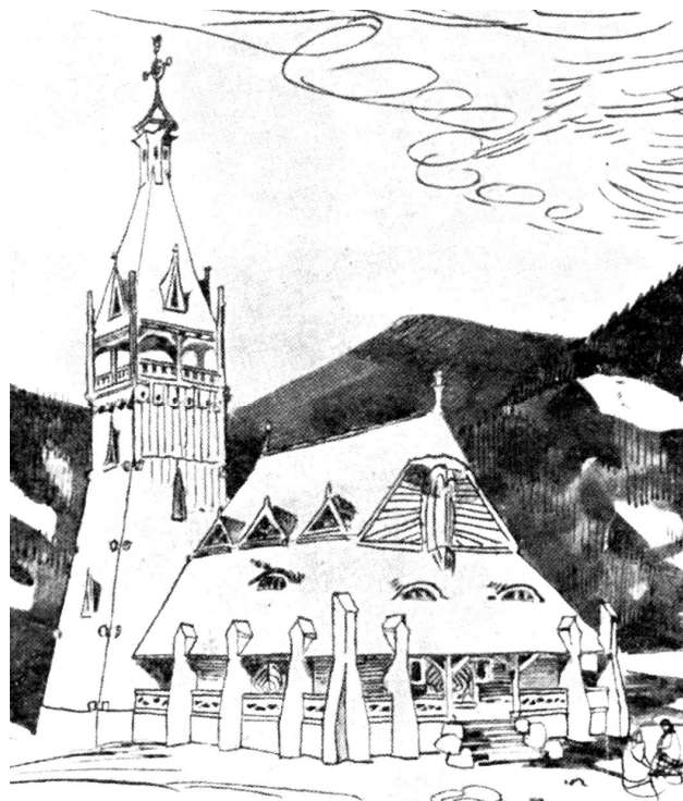
Рис. 2. Проект дерев’яної каплиці 1905 р. у Верховині Івано-Франківської обл. [1, с. 242; 11]

Творчість архітекторів, які проектували курортні будівлі, позначилась і на сакральній архітектурі цих поселень. Так, яскравим прикладом наслідування „норвезького” стилю був нереалізований проект дерев’яної громадської каплиці 1905 р. у Верховині (Жаб’є) Івано-Франківської обл. арх. Франциска Мончинського [1, с. 237] (рис. 2), який гармонійно доповнив архітектурні риси модерну та сецесії. Аналогом міг послужити проект дерев’яного костелу 1887 р. в Никирці (Швеція) архітектора Е.-А. Якобсона, позначився на вирішенні вежі та хреста на її завершенні, різьбі на краях гребенів даху, мансардних віконечок (рис. 3–а). Аналогом міг також бути дерев’яний скандинавський костел в Кіруні (1900–1912 рр.) архітектора Густава Віцкмана, з нього почерпнуто фігури на схилі даху, стовпи галерей – у вигляді контрфорсів (рис. 3–б) [1, с. 242].