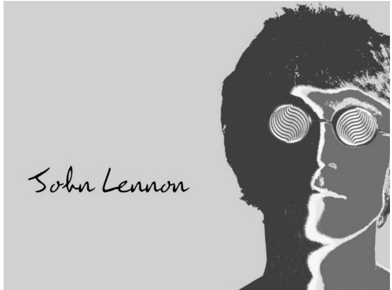
Рис. 2. Роботи представників поп-арту.

Стріт-арт (англ. street – вулиця) - один з найвпливовіших напрямів андеграунду з часів панку. Це нова форма мистецтва, що виросла з графіті сплавленого з мінімал-артом, колажем, асамбляжем, флюксусом, концептуальним мистецтвом. Стріт-арт - мистецтво нового покоління, що використовує наклейки, трафарети, плакати, просторові асамбляжі та інсталяції, соціоскульптуру та «нео-редімейд» (нові «готові речі») з метою залишити згадку про себе будь-якими засобами. Головним для творців стріт-арту є реакція публіки на недовговічні твори, а не слава і не гроші. Імена та прізвиська діячів «вуличної культури», шедеври якої створюються на межі закону переважно вночі на найкращих стінах будинків міст світу, стали відомі завдяки документальному фільму «Вихід крізь сувенірну лавку» Т.Гуети (пізніше відомого як MBW – «містер мозкоправ») під редакцією провокатору і «робін гуду» стріт-арту Бенксі. Серед них Space Invader (космічний захватчик), що створює твори про космічних прибульців із мозаїки; Monsieur Andre (мсьє Анрі), який зображує історію життя мультяшного персонажу – обличчя; Zeus створює галерею під відкритим небом, домальовуючи тіні на асфальті від різних речей; Шепард Ері, завдяки експериментам із повторюючимися зображеннями котрого уявна влада образу перетворюється в справжню; художниця Swoon, що обирає стіни для розпису помацавши їх, враховуючи текстуру (Рис. 3).