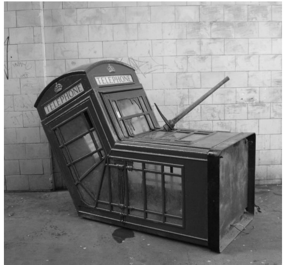
Рис. 3. Роботи представнику стріт-арту Бенксі: а). Малюнок на стіні вуличного будинку; б). Інсталяція «Смерть червоної телефонної буди».

Інвайронмент (англ. environment - середовище) – «мистецтво довкілля». В архітектурі воно передбачає перенесення акценту зі споруди на оточення, перехід від проектування форми до організації предметно-просторового середовища. Архітектор стає «втягнутим» у міські ситуації, і, розробляючи сценарні «ходи», організовуючи процес руху, звертає увагу не так на форму, як на драматургію архітектурно-містобудівних композицій. У сфері дизайну йдеться про мистецтво естетизації, оформлення середовища. Як приклад можна навести твори Н.Секине та японської групи «Інвайронментл Арт Студіо». Як один з провідних видів візуального мистецтва інвайронмент передбачає створення або перетворення певного пейзажного або предметного довкілля, штучних просторів, часто з пародійним відтінком. Інвайронмент поетизує самоцінні розріднені фрагменти довкола людини. Іноді в ньому використовуються елементи ленд-арту – трансформації природних об'єктів (траншей, насипу та інших форм штучного рельєфу) (Рис. 4).