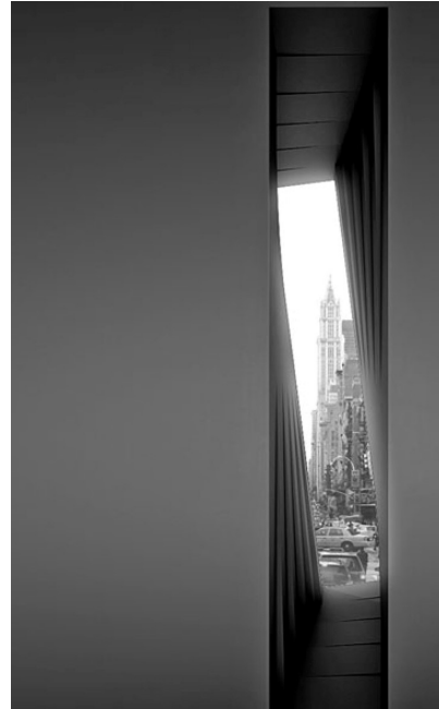
Рис. 1. Проект Metamorfozi на виставці Cersaie в м. Болонья, 2011р:

а). Скульптурна композиція Gulio Iacchetti для Ceramica Globo ;