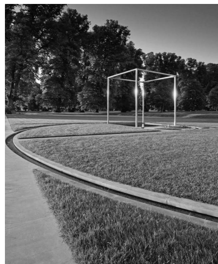
Рис. 4. Ландшафтний об'єкт «Орфей», арх.. Кім Уілкі, м. Боутон, Англія.